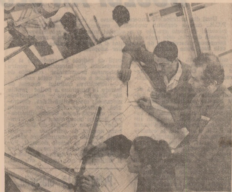
În atelierul de proiectare se analizează detaliile unui nou utilaj care va fi executat în sectorul mecano-energetic pentru dotarea întreprinderii

6. Utilajele de construcție. În esență, sectorul de construc-