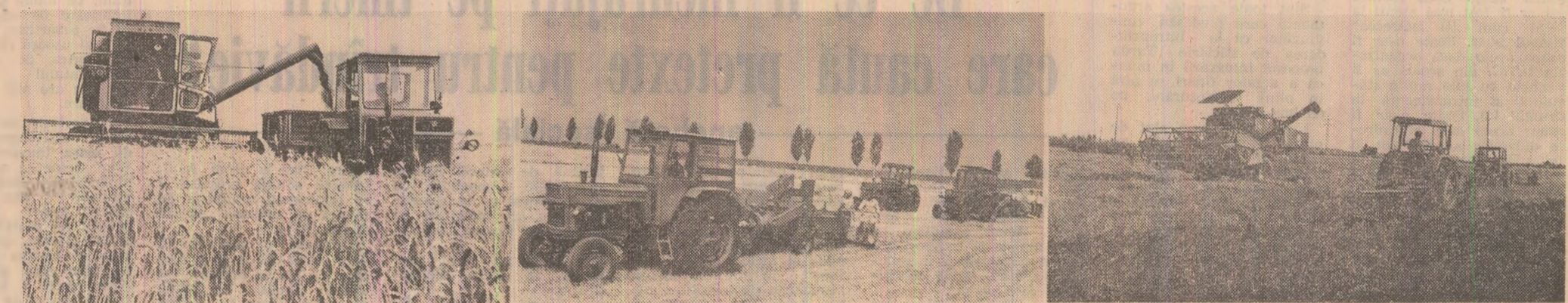
Muncă intensă în lanurile țării: se strînge o recoltă și se pregătește alta. Pentru aceasta se cere ca lucrările să se desfășoare în flux continuu, așa cum au fost surprinse de obiectivul aparatului de fotografiat: recoltarea grului, eliberarea neîntîrziată a terenului de paie, executarea arăturilor și semănatul culturilor succesive. (În pagina a III-a: TIMPUL PRESEAZĂ — ȘI TOATE FORȚELE MECANICE ȘI UMANE DE LA SATE TREBUIE FOLOSITE DIN PLIN PENTRU STRINGEREA RECOLTEI DE GRU ȘI ÎNSĂMÎNȚAREA CULTURILOR SUCCESSIVE)