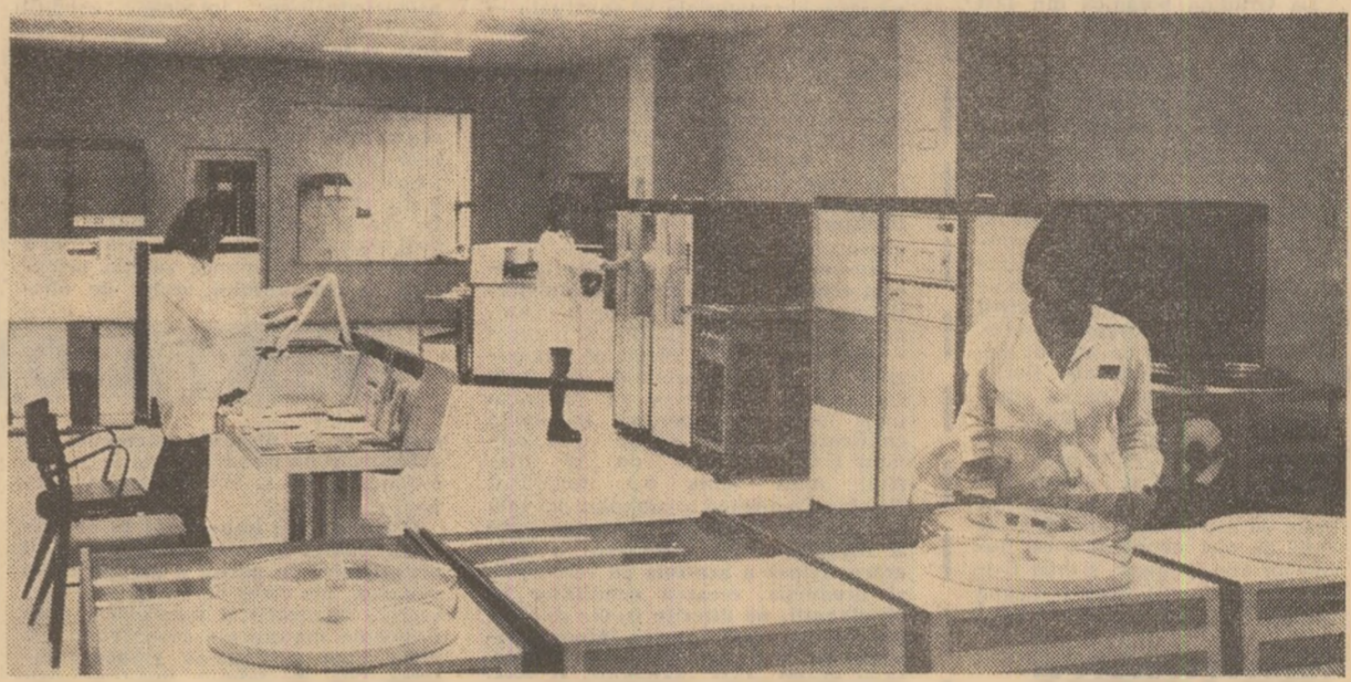
În sala calculatoarelor electronice de la întreprinderea „Electroputere” Craiova

securității în întreaga lume, că organizația județeană de partid, toți oamenii muncii suceveni își vor spori eforturile creatoare în scopul îndeplinirii mărețului Program adoptat de Congresul al XI-lea al partidului, aducîndu-ne astfel contribuția la înflorirea României socialiste.