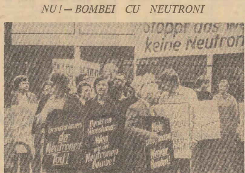
„Amintiți-vă de Hiroșima: NU bombel cu neutroni”, „Boraiți drumul bombel cu neutroni” — sub asemenea lozinci s-a desfășurat la Düsseldorf, R.F.G., o demonstrație a cetățenilor din acest oraș

Fenomenul în vogă în unele țări capitaliste „punk” — muzica pteziciunilor — stîrnește o vie înjurătoare în Marea Britanie, astfel de spectacole” în aer liber sîndu-se de regulă cu grave perturbări ale liniștii publice. În plin sezon estival, sute și sute de hainănele — cum se exprimă A.F.P. englezii și străinii, au luat cu asalt felișurile puncte ale arhipelagului britanic, în dorința de a se manifesta în voce, în ambianța unei asemenea muzici a degradării. În urma unui șir de incidente, autoritățile au procedat la areștări, o serie de tineri adepți ai „punk” fiind traduși în fața justiției.