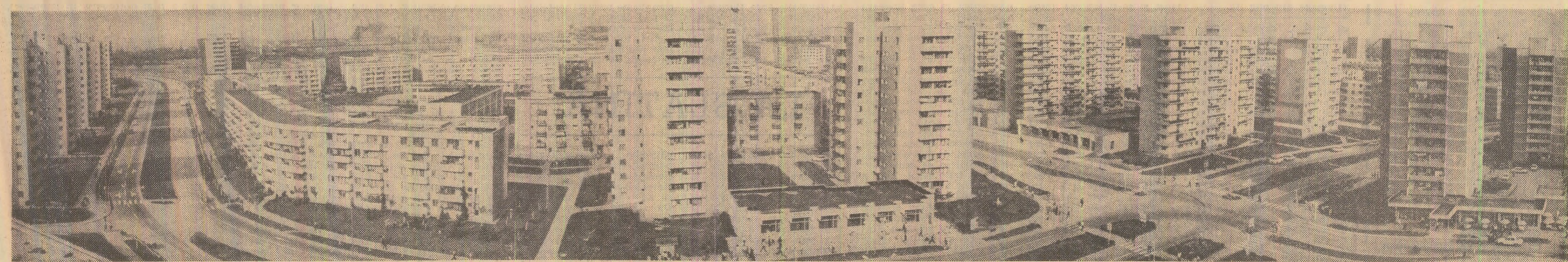
Cine ar mai recunoaște, sub această înfățișare, vechea Slatina? Un oraș înnoit din temelii, al cărui cititor este industrializarea socialistă

Ioan GRIGORESCU (Continuare în pag. a II-a)