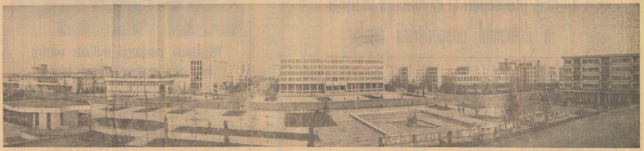
SLOBOZIA: urbanistică modernă în Cîmpia Soarelui