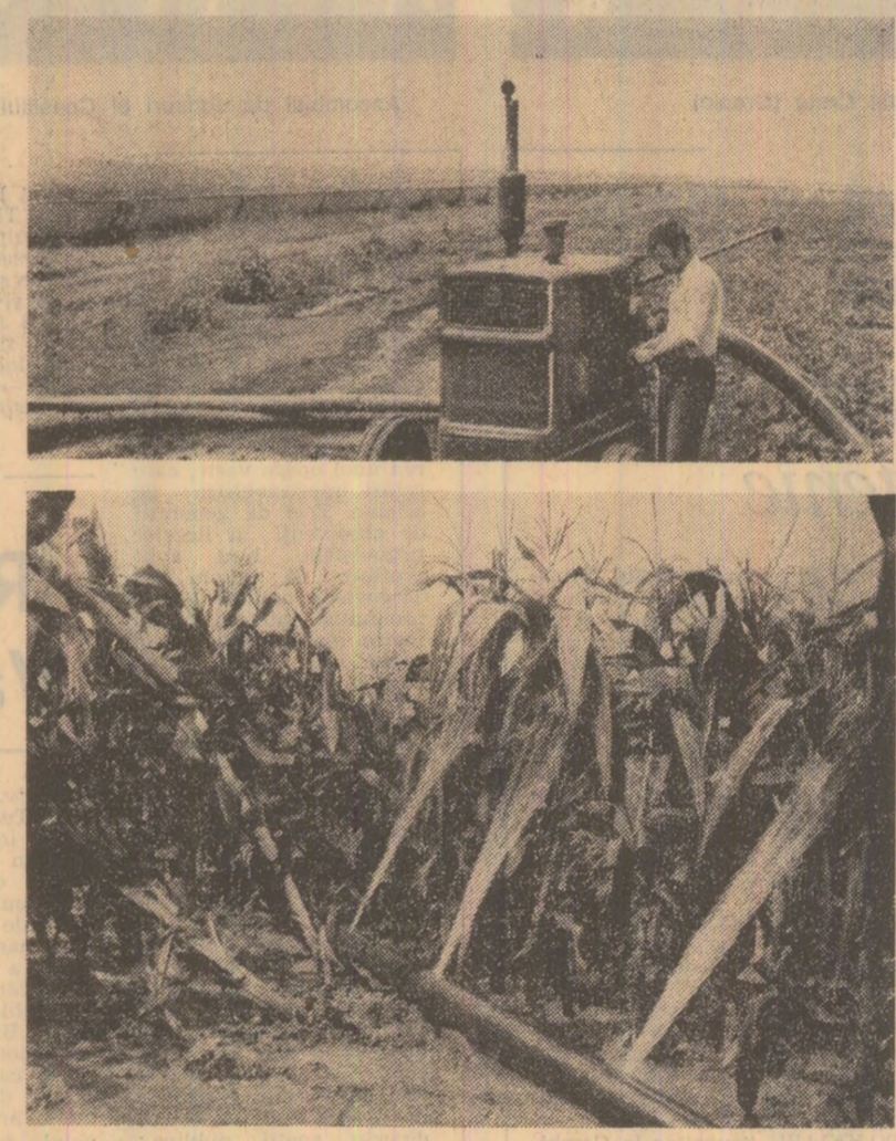
Instantaneu din județul Constanța relevind ariditatea gospodăriilor pentru irizarea orzanelor. La C.A.P. Cobadin se urmărește cu atenție irizarea terenurilor plantate cu soia. La C.A.P. Ciocirila de Sus însă, instalațiile improvizate produce mare risipă de apă.