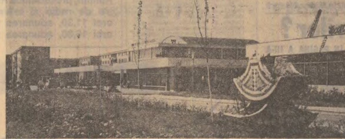
Construcții noi la Motru (județul Gorj)

În ansamblul preocupărilor Comitetului Județean Suceava al P.C.R., pe un plan principal se situează creșterea și educarea tinerii tineretului, însușirea de idealurile nobile ale socialismului, de principii moralei comuniste, cu un larg orizont de cunoștințe, capabili să participe activ, cu pasiune și răspundere, la dobîndirea marilor realizări ale prezentului, la înfăptuirea celor viitoare.