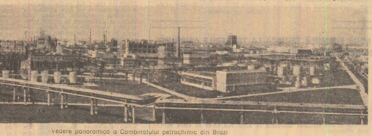
Vedere panoramică a Combinatului Petrochimic din Brazi

Poate că cel mai bine ilustrează pentru muncitorimea ploieștenă ce a însemnat ziua de 23 August alături de victoria în insurecția care opțesese puț tehnicii armate germane