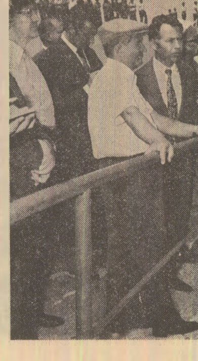
Gîrla, cea mai mare carieră productivă din țară

Examinarea posibilităților și a rezultatelor a pus în evidență faptul că acest sector modern utilat al minerului, în care productivitatea muncii este de 12—15 ori mai mare decît în subteran, poate să treacă