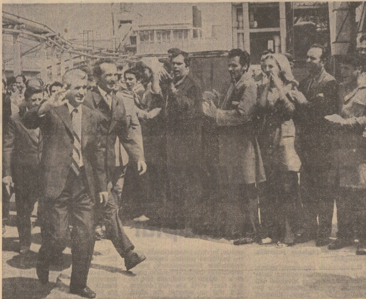
Printre muncitorii Combinatului de prelucrare a lemnului

Orasul este în plină dezvoltare, în construcție se află alte 540 de apartamente și o poliniclinică. Recent au început lucrările la o fabrică de tricotate, unitate ce va asigura locuri de muncă pentru mai mult de 1.200 femei — soții și fiice ale minerilor de aici. Planurile de expansiune urbanistică a Motrului prevăd îmbogățirea zestrei sale edificare până la finele actualului cincinal cu 2.000 apartamente, cu cămine pentru ne-familisti dispunând de peste 1.800 locuri.