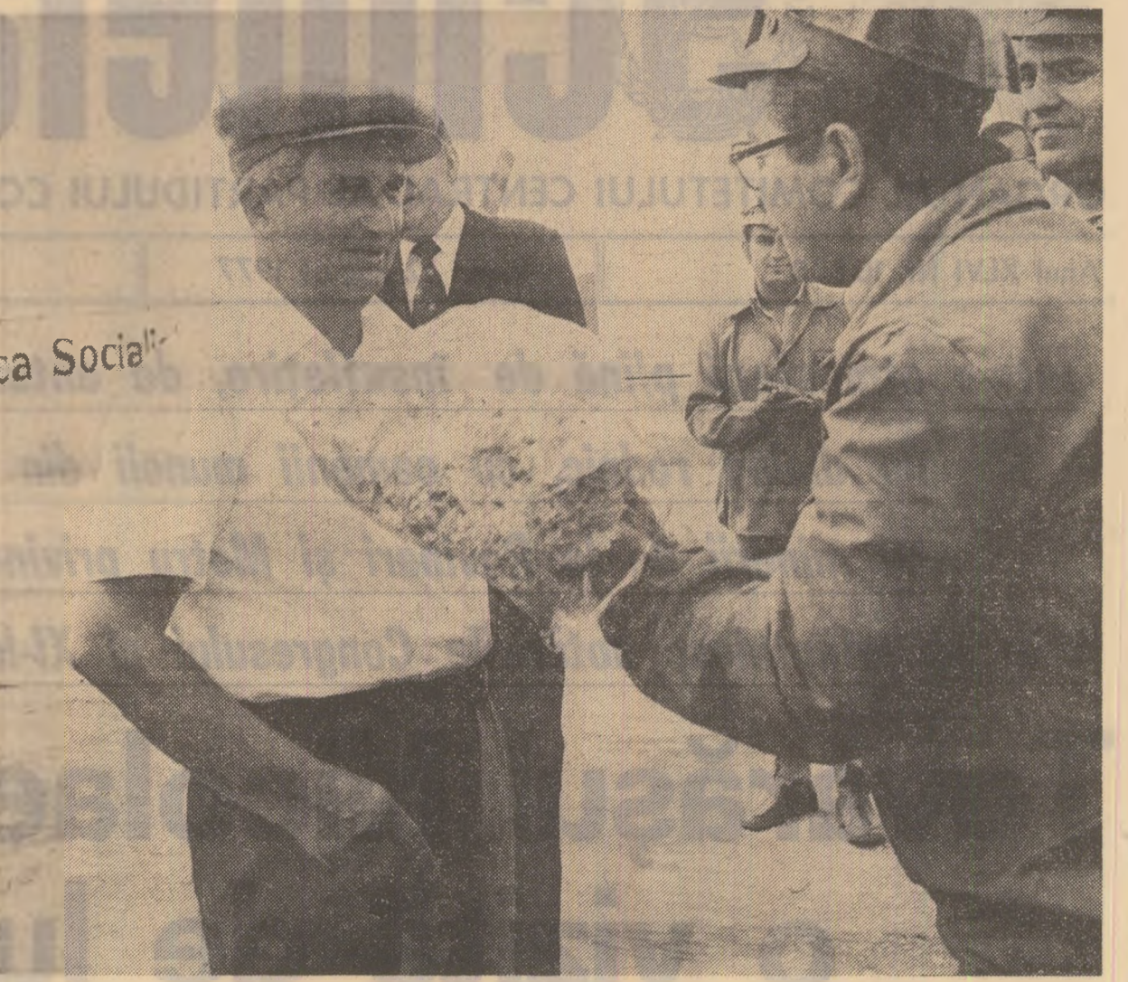
Un buchet de flori. Nobil omagiu adus conducătorului iubit de minerii de la Roșia de Jiu

În această însoțită zi de vară, orașul a îmbrăcat straie de sărbătoare, arterele sale sunt împodobite cu drapelulele partidului și statului, cu urări de bun venit adresate secretarului general al partidului. Cu mîle, cu mare, locuitorii Motrului și ai așezărilor din împrejurimi au ieșit cu flori să întâmpine pe conducătorul iubit al partidului și statului nostru, tovarășul Nicolae Ceaușescu. La aterizarea elicopterului prezidențial, mii de munceri și alți oameni ai muncii, împreună cu familiile lor, aflați pe stadionul orașului, scandează cu înflăcărare „Ceaușescu—P.C.R.!", „Ceaușescu și poporul!", „Ceaușescu și mînerii!". Ei dau glas sentimentelor de adință dragoste și recunoștință față de partidul comunistilor, față de secretarul său general pentru grăia permanentă manifestată față de dezvoltarea economică și socială a așezărilor Motrului, ca și a întregii țări, față de ridicarea necontenită a nivelului de viață al minerilor, al tuturor oamenilor muncii.