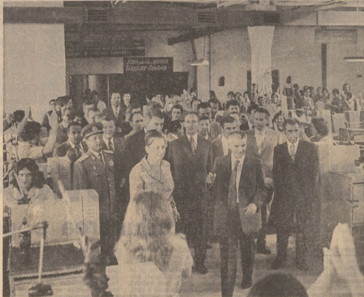
La șlefuitorii în sticlă pentru menaj