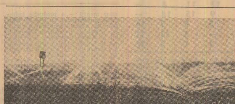
Pe ogoarele C.A.P.-Zimnicea, aspersoarele sistemului de irigații funcționează din plin