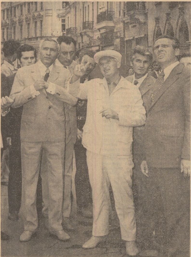
(Urmare din pag. 1)

seism de la 4 martie, se înfățișează astăzi cu totul altfel, datorită muncii pline de abnegație a locuitorilor săi, ce au răspuns, într-un glas, chemării partidului, îndemnul secretarului său general de a-și concentra forțele pentru înălțarea cu mai mult grabnică a următorilor câștigați. Ruinele au