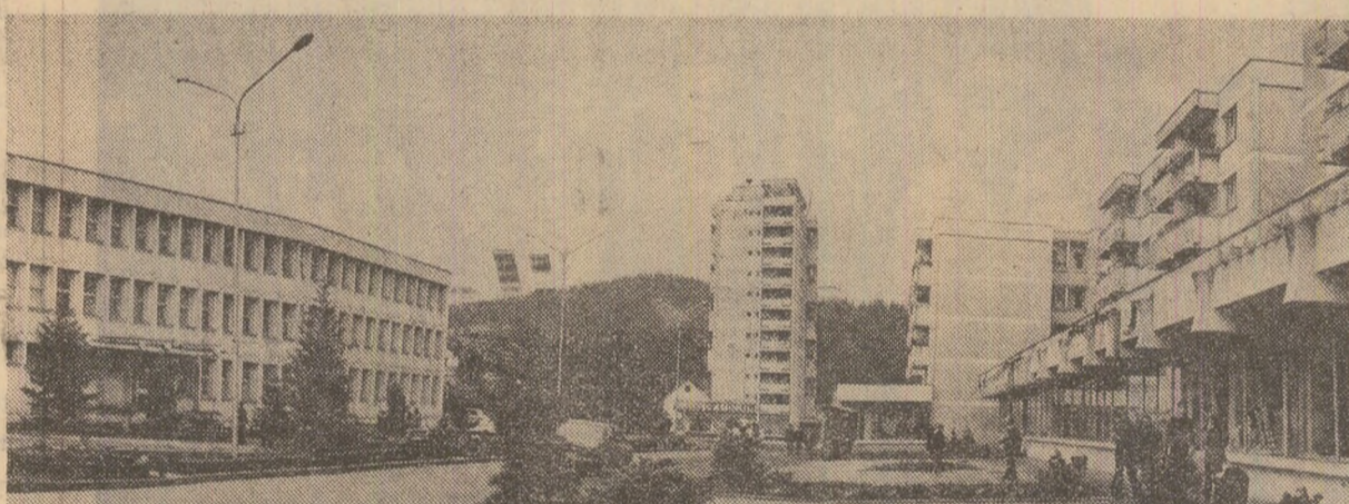
Ca pretutindeni în țară, noile blocuri de locuințe din Cîmpulung Moldovenesc au amplasate la parter unități comerciale și de servicii publice