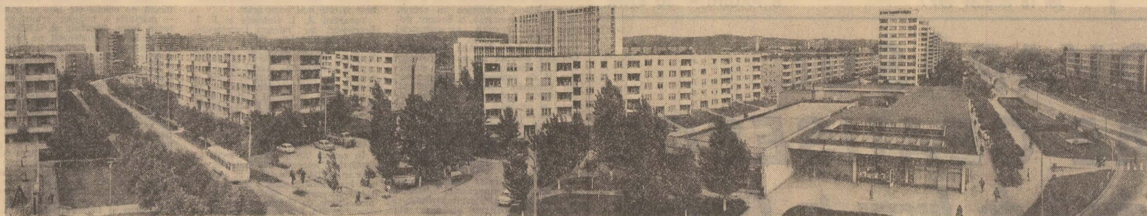
Care sînt condițiile de locuit ale constructorilor socialismului din România? Am ales o imagine panoramică din Oradea, dar ea poate fi întîlnită în orice altă localitate a țării

● În cei 33 de ani de la eliberare s-au construit PESTE 4,4 MILIOANE DE LOCUINȚE , ceea ce înseamnă că APROAPE 70 LA SUTĂ DIN ACTUALUL FOND LOCATIV AL ȚĂRII A FOST ÎNNOIT ÎN ACEASTĂ PERIOADĂ. ● În prezent, aproape 15 MILIOANE DE OAMENI de la orașe și sate LOCUIESC ÎN CASE NOI. ● RITMUL DE CREȘTERE A FONDULUI LOCATIV A DEPĂȘIT RITMUL DE CREȘTEREA A POPULAȚIEI; în perioada dintre cele două recensăminte din 1966 și 1977, populația țării a crescut cu 12,9 LA SUTĂ , iar numărul locuințelor a crescut cu 18,5 LA SUTĂ. ● S-a îmbunătățit continuu GRADUL DE CONFORT AL LOCUINȚELOR; numai în perioada 1966-1977 numărul locuințelor dotate cu instalații de energie electrică s-a dublat, cel al dotărilor de instalații de încălzire centrală a crescut de peste 4,3 ori; în același interval de timp, numărul locuințelor alimentate cu apă din rețeaua de distribuție a sporit cu 88,2 la sută.