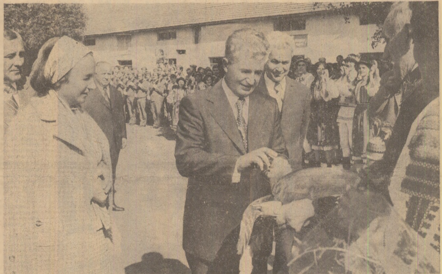
Tovarășul Nicolae Ceaușescu și tovarășa Elena Ceaușescu sînt întîmpinați de locuitorii comunei Cristian, ca pretutindenii pe parcursul vizitei, cu sentimente de stimă și profundă dragoste, cu tradiționala piine și sare

Secretarul general al partidului a analizat la fața locului, împreună cu muncitori, lucrători din agricultură, specialiști, cadre de conducere, cu activul de partid și de stat, probleme de mare importanță privind dezvoltarea economică și socială a localităților județului