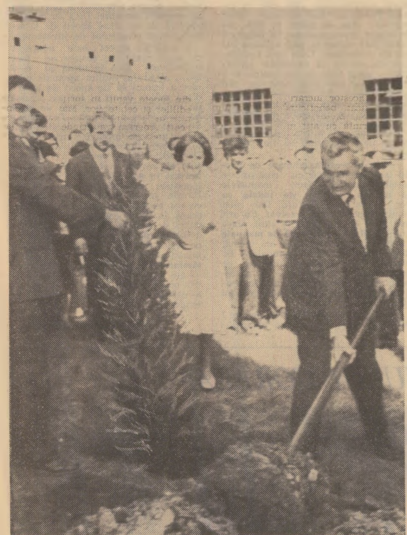
Un moment plin de semnificație: sădirea unui pom al prieteniei

Mulțumind pentru sentimentele prietenești exprimate, tovarășul Nicolae Ceaușescu a spus: