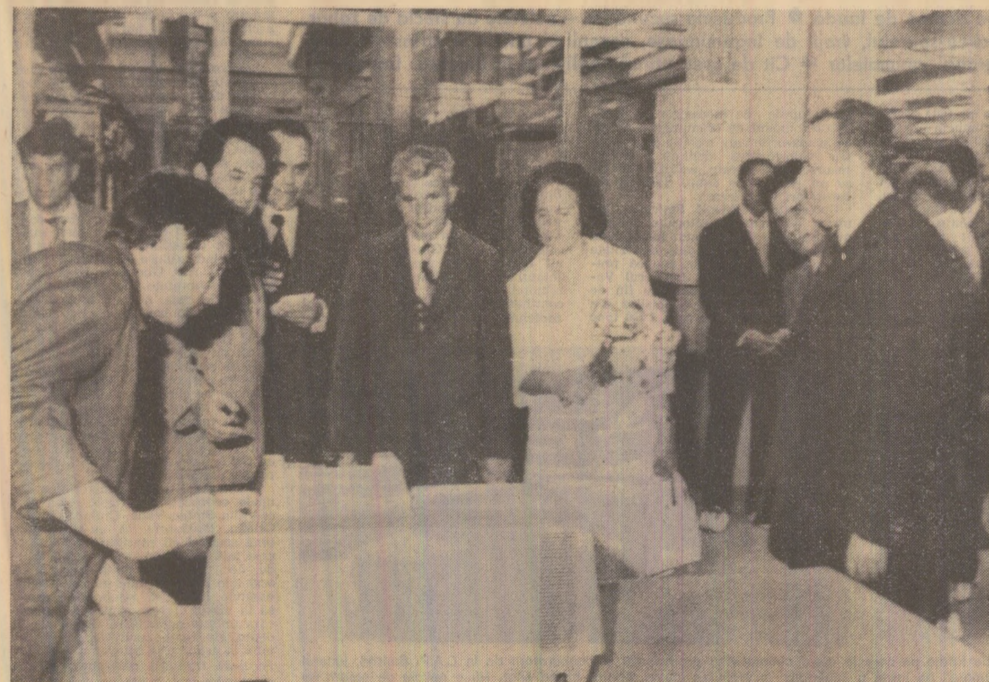
La uzina de elemente integrate pentru calculatoare

Astăzi, în jurul orei 17,30, posturile noastre de radio și televiziune vor transmite direct de la Sofia mitingul prieteniei româno-bulgare