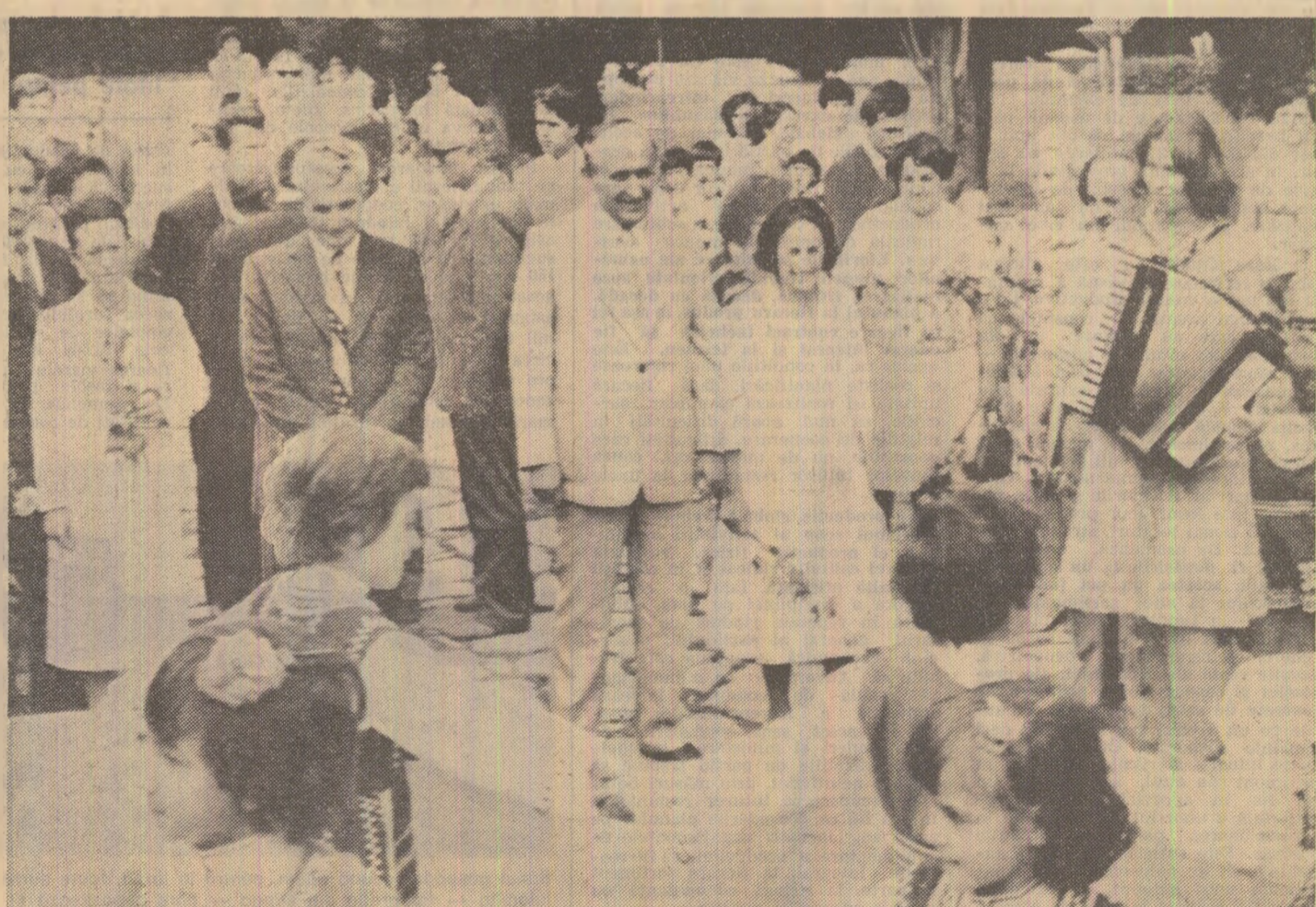
Înaltii oaspeți sînt întâmpinați cu dragoste și bucurie