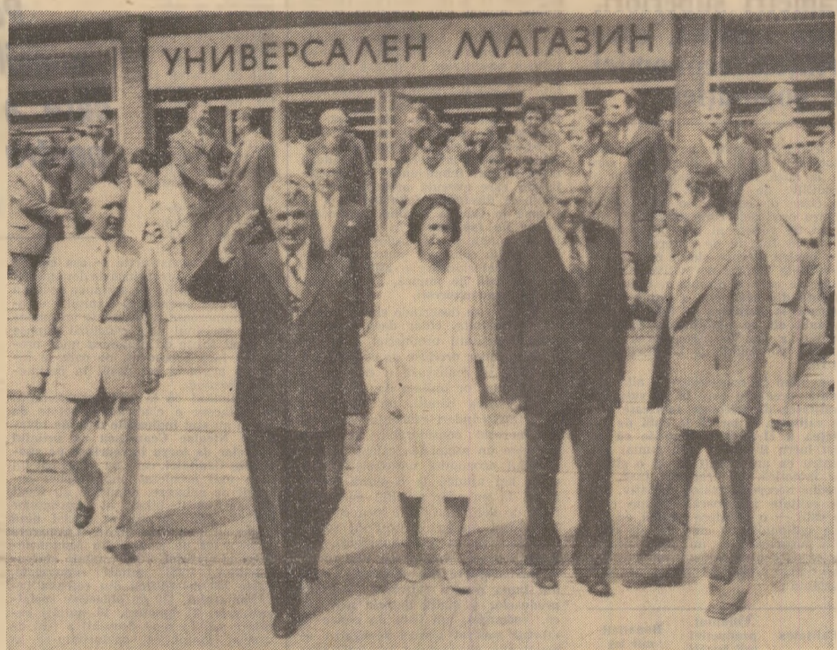
În timpul vizitei la Stara Zagora

Manifestările oficiale, întîlnirile cu oameni ai muncii din mari unități economice pun în relief dorința comună de a valorifica din plin posibilitățile existente pentru extinderea și adîncirea conlucrării frățești, pe multiple planuri, în interesul progresului mai rapid al operei de construcție socialistă în cele două țări, al cauzei generale a socialismului și păcii