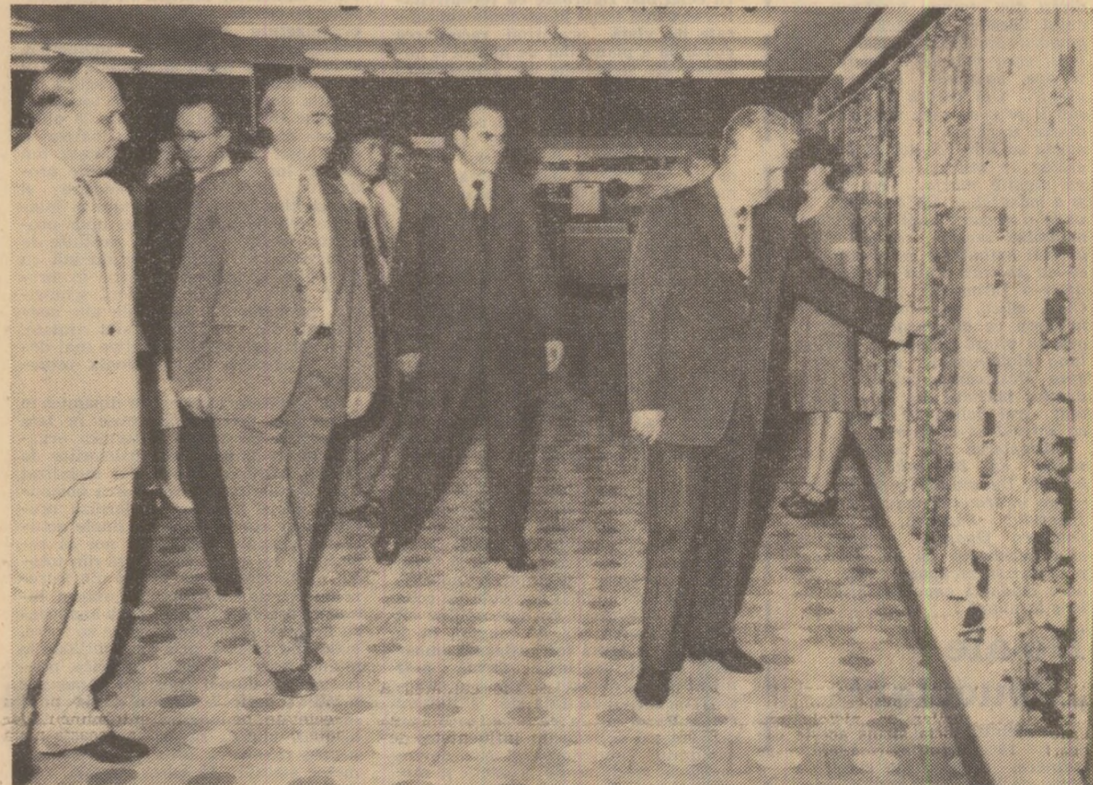
Se vizitează cel mai nou și modern magazin universal al orașului