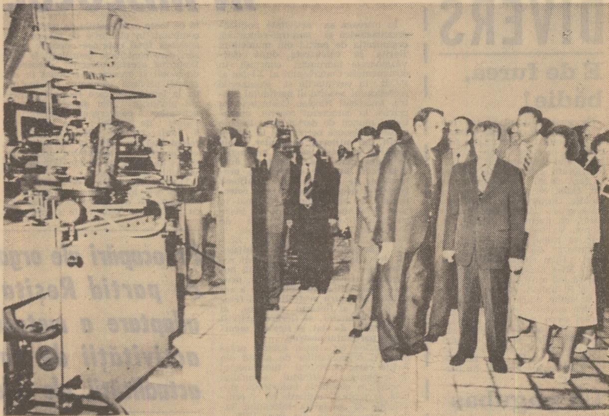
Într-una din secțiile întreprinderii „Beroc”

În sănătatea dumneavoastră, a tuturor! (Aplauze).