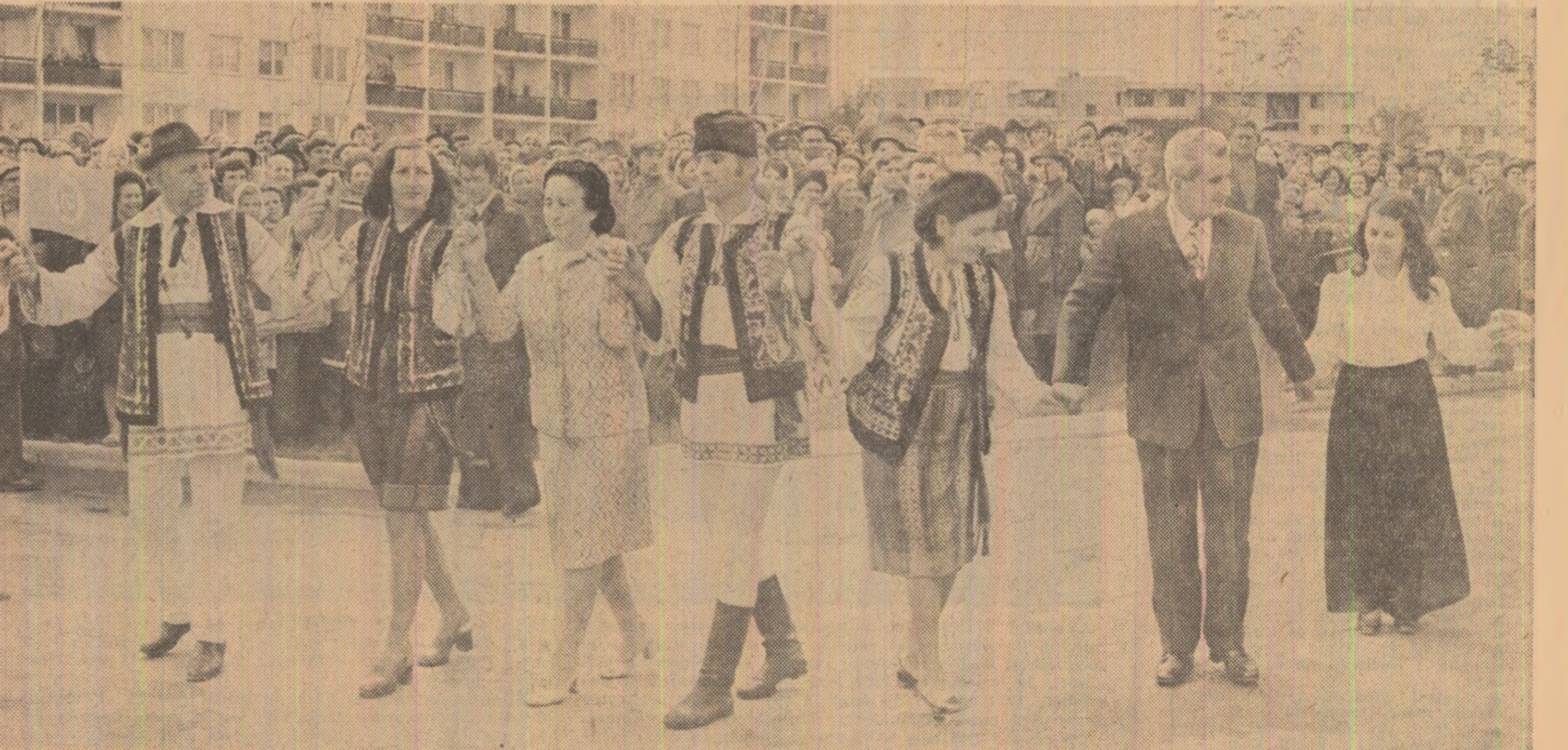
Tovarăşul Nicolae Ceauşescu, tovarășa Elena Ceauşescu — în marea horă din piața Pașcaniului