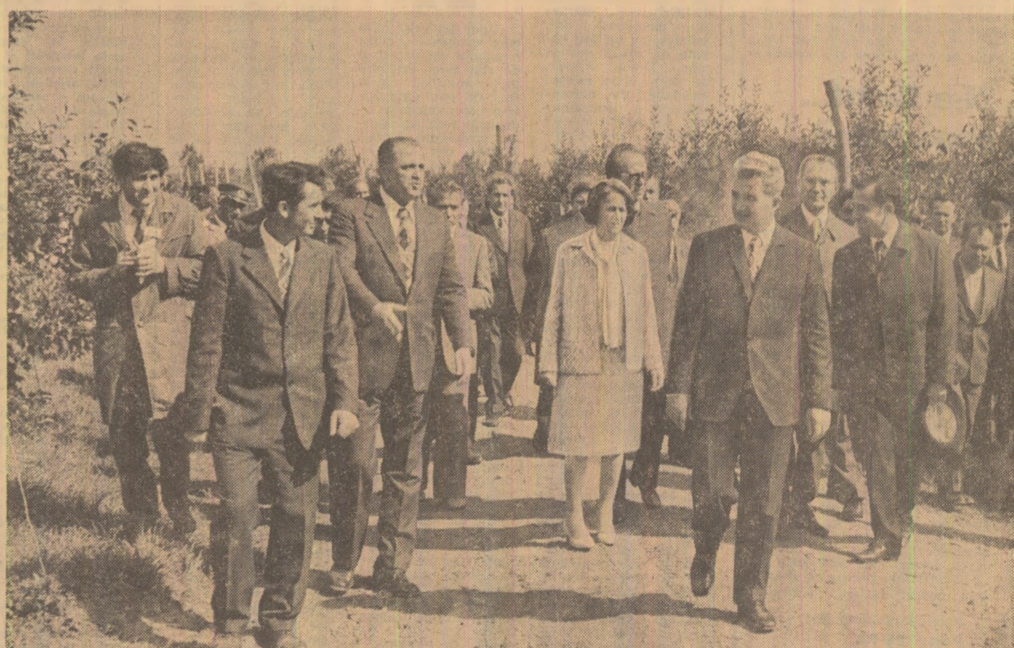
Se vizitează ferma pomicolă a cooperativei agricole de producție din Bivolari