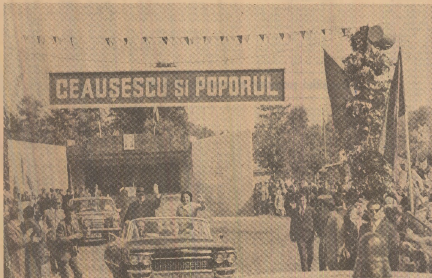
Președintele, pe parcursul vizitei, o primire caldă, plină de bucurie și recunoștință

De asemenea, cu prilejul vizitei de lucru în județul Botoșani a tovarășului Nicolae Ceaușescu, posturile noastre de radio și televiziune vor transmite direct, azi, în jurul orei 16, adunarea populară din municipiul Botoșani.