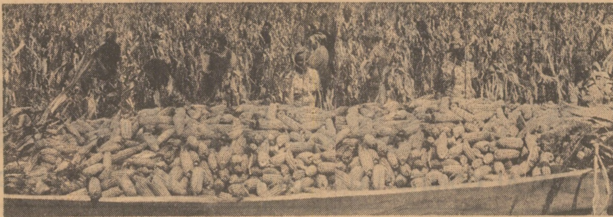
Din zori și pînă seara, cooperatorii din Stăncuța, județul Brăila, muncesc la recoltarea și transportul porumbului.