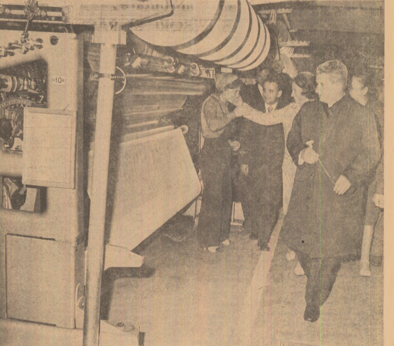
La întreprinderea de tricotaje și perdelă din Pașcani