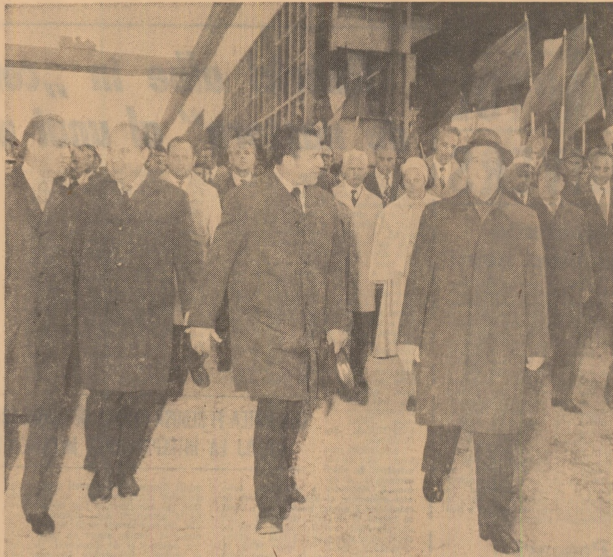
În timpul vizitei pe platforma Combinatului de utilaj greu Nicolina — Iași