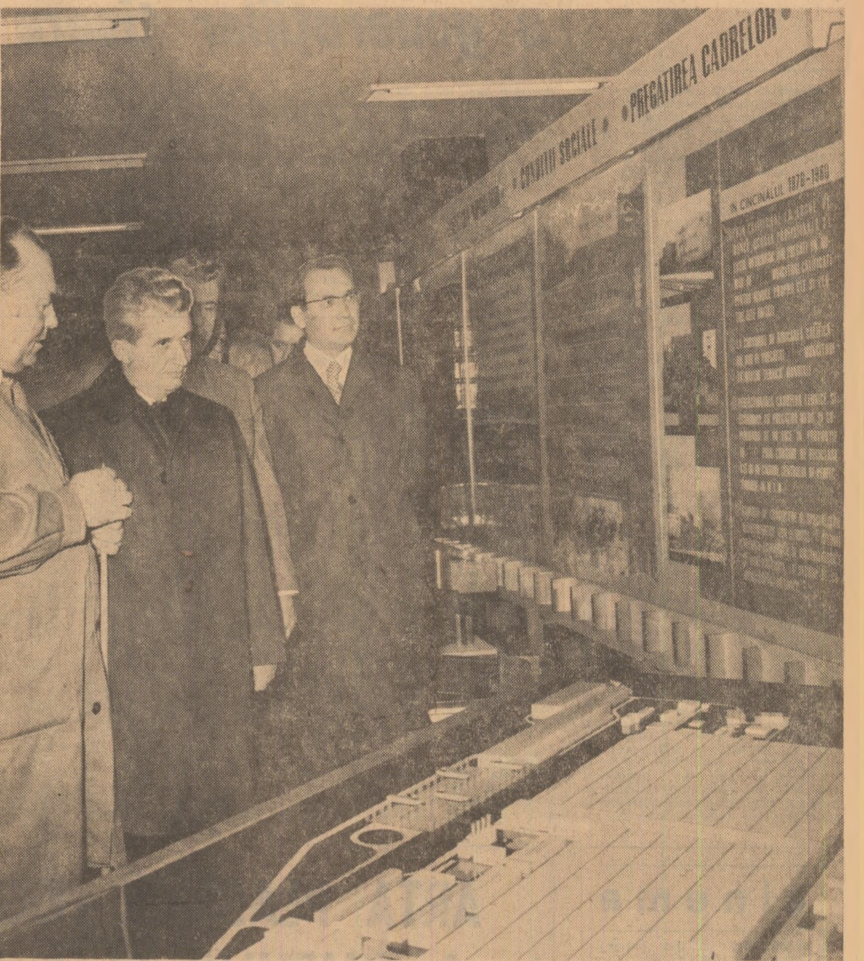
La întreprinderea metalurgică din Iași

Tovarăşul Nicolae Ceauşescu, tovarășa Elena Ceauşescu — în marea horă din piața Pașcaniului