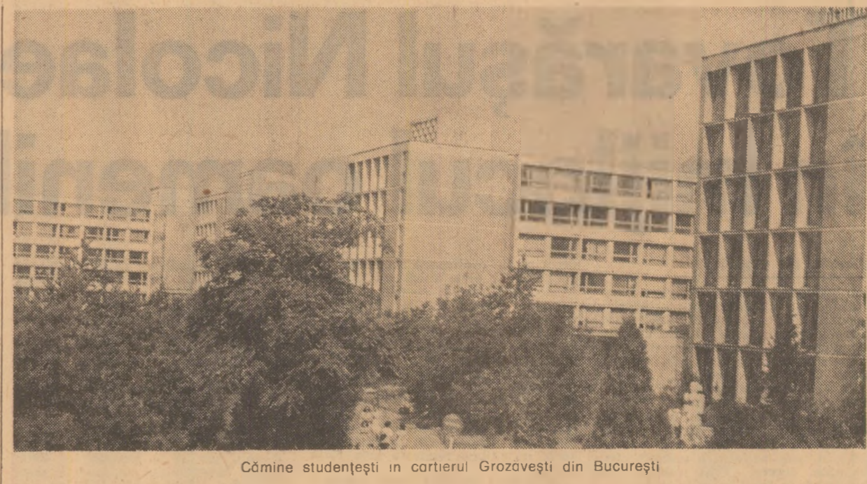
Cămine studenteşti în cartierul Grozoveşti din Bucureşti

În învăţământul superior vor fi aplicate în anul 1977-1978 noi măsuri care să contribuie la realizarea unui plus de bunuri, la reducerea termenelor de execuţie a unor obiective, la suplimentarea forţei de muncă. La începutul noii etape de muncă, toţi slujitorii şcolii sînt angajaţi în faţa partidului, în faţa ţării şi a poporului să nu precupească nici un efort pentru îndeplinirea nobilului misiune care a fost încredinţată, să facă din opera de educaţie comunistă a tinerilor generaţii sensibile existenţei şi muncii lor, spre a da patriei luptători înfălcări, constructorii de temelii şcolii ştiinţifice şi comuniste, temeinic pregătiţi pentru viaţă şi muncă.