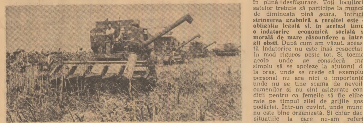
La I.A.S. Dudești, județul Brăila, mijloacele mecanice lucrează grupat pentru grăbirea recoltării ultimelor suprafețe cu floarea-soarelui