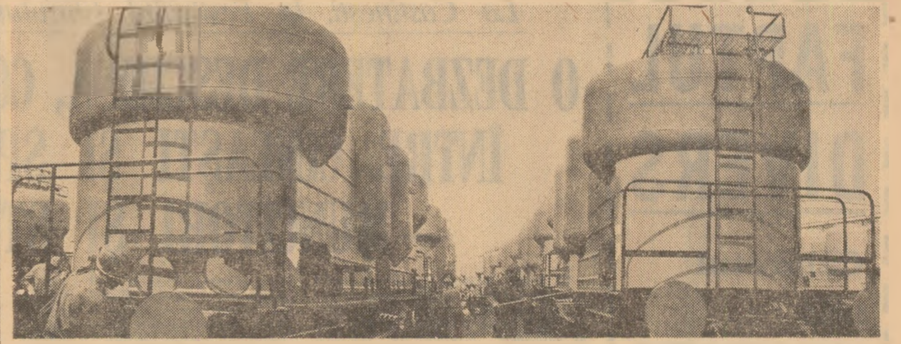
La întreprinderea de vagoane din Drobeta-Turnu Severin: o ultimă revizie înainte de expediere spre beneficiari

prevederile din graficele de recoltare a porumbului nu se îndeplinesc. În aceeași ordine de idei, există încă un decalaj mare între cantitățile de porumb recoltate și cele ajunse la destinație. La direcția agricolă a acestei situații este justificată prin insuficiența mijloacelor de transport. În realitate, nici cele de care dispun unitățile nu sînt folosite deplin. Iată un caz. La centrul de legume și fructe Portărești sînt preluate zilnic 150—180 tone de legume, față de 300 tone cit