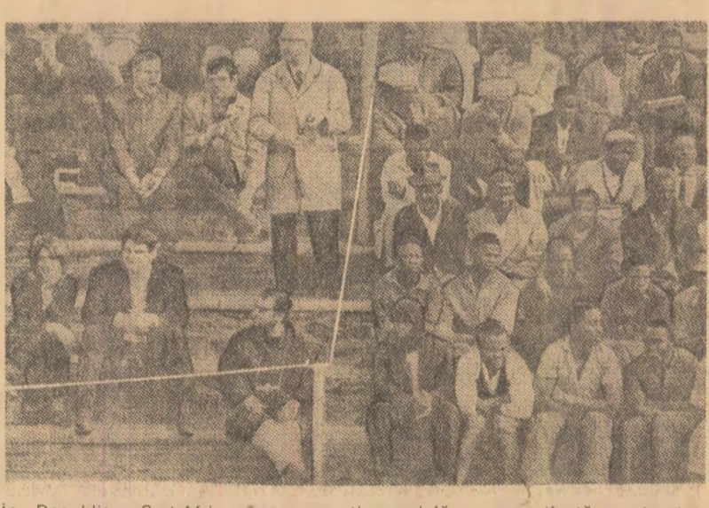
În Republica Sud-Africană segregarea rasială se manifestă peste tot, inclusiv pe străzile.

JOHANNESBURG 24 (Agerpres). — Politia sud-africană a arestat vineri seara mai multe sute de africani care se pregăteau să părăsească Soweto pentru a participa duminică, la King William's Town, la funeraliile lui Steve Biko, lider al populației africane, mort în închisoare săptămîna trecută, informează agenția France