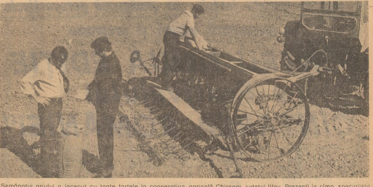
Semănatul grîului a început cu toate forțele la cooperativa agricolă Chirnoși, județul Ilfov. Prezenți în cîmp, specialiștii urmăresc executarea unor lucrări de cea mai bună calitate

Concură însă la această situație, și nu în măsură mică, proiectantul și beneficiarul. La 31 august, de exemplu, o cincime din planul de locuințe pe acest an nu avea condiții de realizare: documentație, finanțare, amplasamente. Fiecare, înseamnă că 480 de apartamente nu vor putea fi sub nici o formă date în folosință pînă la 31 decembrie. Sursă rezonabilă, toamă întreprinderea județeană de răspundere comunală și locală nu-și respectă obligațiile care-i revin. Sint deci greuțități reale și alte subiective. Dar mai există un colectiv de constructori care începe să se realizeze. În această privință, tovarășul inginer Aurel Dămaroiu, vicepreședintele al comitetului executiv al consiliului popular județean, ne-a declarat: „Pentru prima dată au fost începute lucrările de execuție la peste 1.200 de apartamente din planul anului 1978 și ne străduim ca pînă la 31 decembrie să asigurăm condițiile și să declanșăm execuția