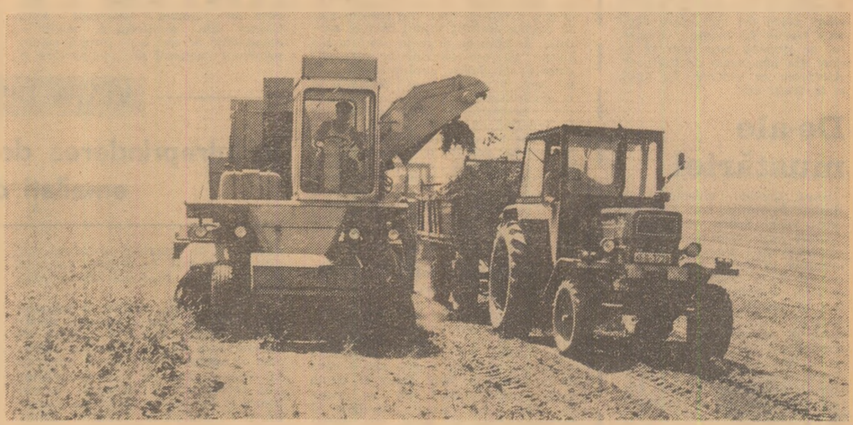
Utilaje de mare productivitate folosite la recoltarea sfeclii de zahăr. Aspect de muncă de pe terenurile cooperativei agricole Știința, județul Ialomița

rul Danemarcei a avut loc o convorbire care s-a desfășurat într-o atmosferă cordială.