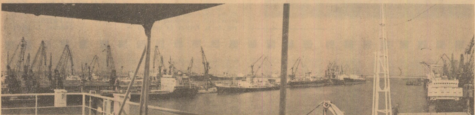
La danele noului port maritim Constanța

Floriștea completă a timpului de lucru și mobilizarea la muncă a întregii forțe ale de muncă, trebuie să constituie în aceste zile o înaltă