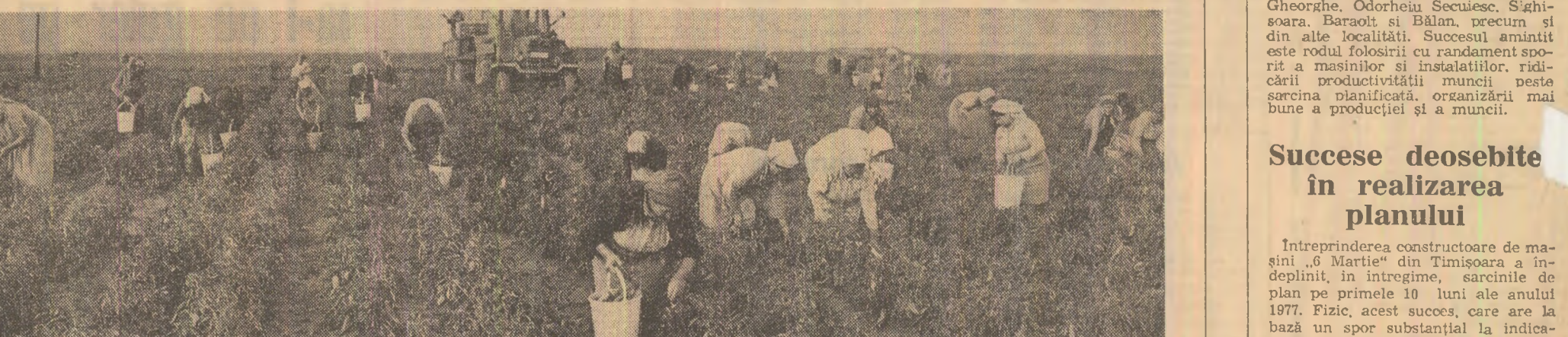
Nimic din recolta acestui an să nu rămînă pe cîmp! La I.A.S. Căldrăși, județul Ialomița, importante forțe au fost concentrate la strînsul și valorifi-carea integrală a producției de ardei.

pentru hrana poporului să nu se piardă. Desigur, pe primul plan în ochii urzelenilor se înscrie strîngerea tuturor cantităților de legume aflate pe cîmp. Din evaluările făcute de specialiștii rezultă că mai sînt pe recoltat importante cantități de tomate, ardei gras, ardei kapia, gogoșari. De aceea, pentru evitarea oricărei pierderi este necesar să se recolteze imediat tot ceea ce a mai rămas bun pe cîmp și să se livreze operativ spre piețe și la fabricile de prelucrare. În județul Prahova, de pildă, desi brumele au cauzat pierderi apreciable, numai în cooperativele agricole mai pot fi recoltate cel puțin 5.000 tone tomate, 240 tone ardei gras, 420 tone ardei kapia, 460 tone gogoșari s.a. Cantități mari de legume mai sînt de strîns și în județele Ilfov, Ialomița, Teleorman, Arad, Bihor, Satu Mare, Tulcea, Mehedinți s.a. Comandamentele județene și locale, organizațiile de partid din agricultură și conducătorii unităților agricole au datoria să ia nemîrzîrit măsuri ca în această săp-tămină legumele aflate încă pe cîmp să fie recoltate și livrate la fabricile de conserve și spre piețe. În aceste condiții, specialiștii recomandă să fie recoltate chiar și acele produse care nu au ajuns complet la maturitate și să se ia măsuri pentru punerea lor la postmaturare. Culturile care nu au fost compromise de brume vor fi protejate cu paie, vrefi și pînă cînd producția va putea fi strînsă.