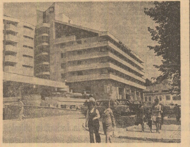
Invitație la munte

Întreprinderea produce perle cu lățime normală de 2,30 metri, cu borșură și flori, cit și perlele înguste sub 2 metri, imprimare în culori vii, pastele. Sînt căutate tot mai mult lenjeria fină, precum buzele, cămășile, rochiile, pantaloni etc. produse în peste 400 de modele și poziii coloristice, dintre care mai bine de jumătate sînt realizate în acest an, la sugerțiile și propunerile cumpărătorilor (Manole Corcaci, corespondentul „Scintei”).