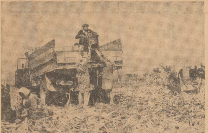
Un exemplu de bună organizare a muncii: La C.A.P. Pietroasele, județul Buzău, recoltarea porumbului, transportul producției și eliberarea terenului de coceni se execută concomitent.