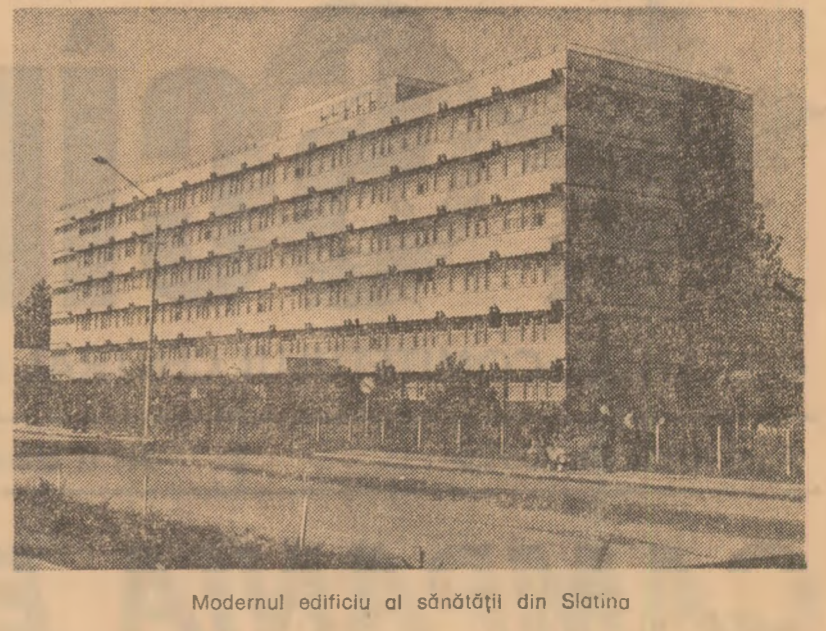
Modernul edificiu al sănătoștii din Slatina

sînt chemate să desfășoare o largă muncă de educație și organizare politică, pentru îndeplinirea și depășirea sarcinilor de plan și a angajamentelor asumate de către fiecare colectiv de muncă, pentru înfrîntarea măsurilor de creștere suplimentară a productivității muncii, folosirea cu eficiență maximă a mijloacelor tehnice și a timpului de lucru, pentru reducerea continuă a consumurilor de materii prime și mate-