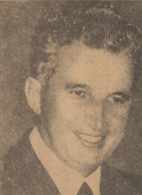
CEAUŞESCU OCH ROMÂNIIEN

munist Român, pentru dreptate, libertate și progrese sociale. „În personalitatea prezidentului Nicolae Ceaulescu — scrie autorul — se contopesc convingerile comuniste și