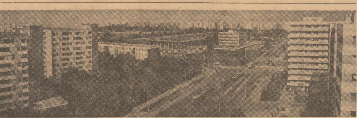
Cartierul Militari din Capitală văzut dinspre cartierul Drumul Taberei

crearea liniei de autobuze I11 care va lega cartierul Chitila, București Noi, Pajura și Piața Științei și experimentarea unui nou sistem de transport cu asigurațiile maxi-taxi, între Drumul Taberei și Piața Roșie.