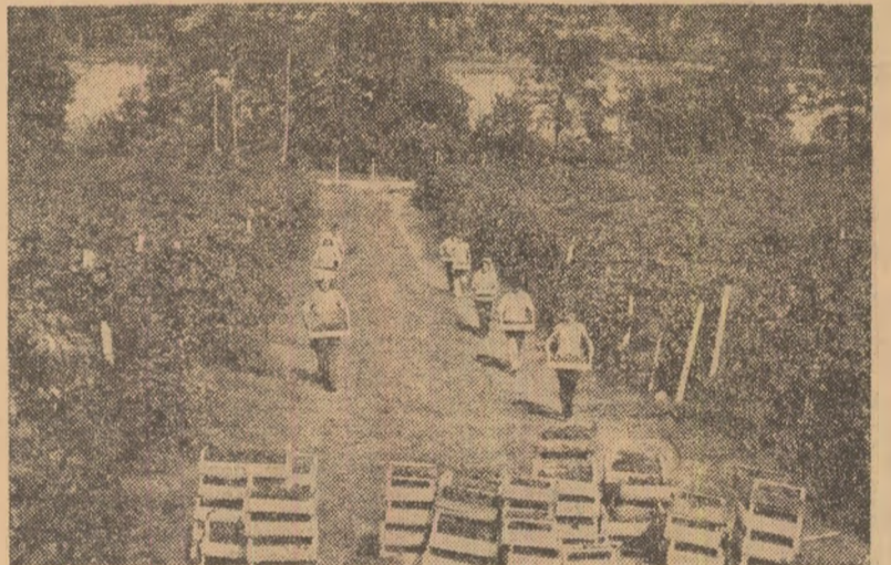
La I.A.S. Valea Călugărească, județul Prahova, în podgorii se muncеște de zor, ca în această săptămîna să se încheie culesul strugurilor.