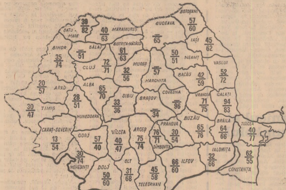
Cifrele înscrise în perimetrul fiecărui județ redau în procente suprafețele însămînțate cu grâu în întreprinderile agricole de stat (sus) și în cooperativile agricole (jos) la data de 11 octombrie a.c.

• Este posibil și necesar ca însămînțările de toamnă să se încheie în această săptămână • Pentru grăbirea lucrărilor trebuie organizată munca în două schimburi și în schimburi prelungește la eliberarea terenului și executarea arăturilor