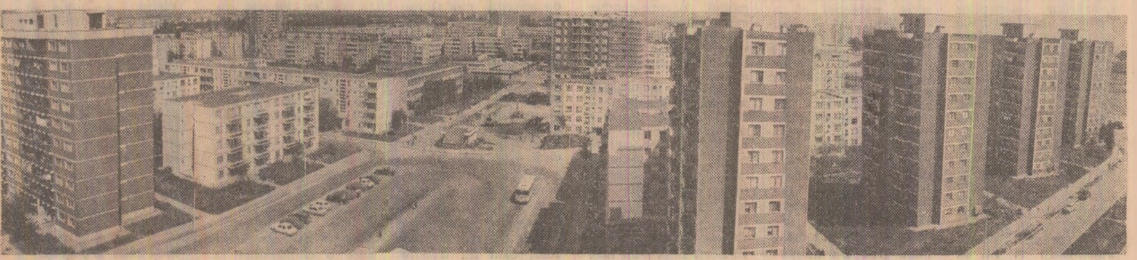
Galați: a căpătat contur noul cartier „Dunărea”.

În încheierea ședinței, Comitetul Politic Executiv a discutat și soluționat probleme privind activitatea curentă de partid și de stat, adoptând măsuri corespunzătoare.