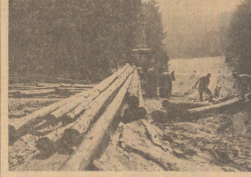
La întreprinderea forestieră de exploatare și transport Miercurea Ciuc