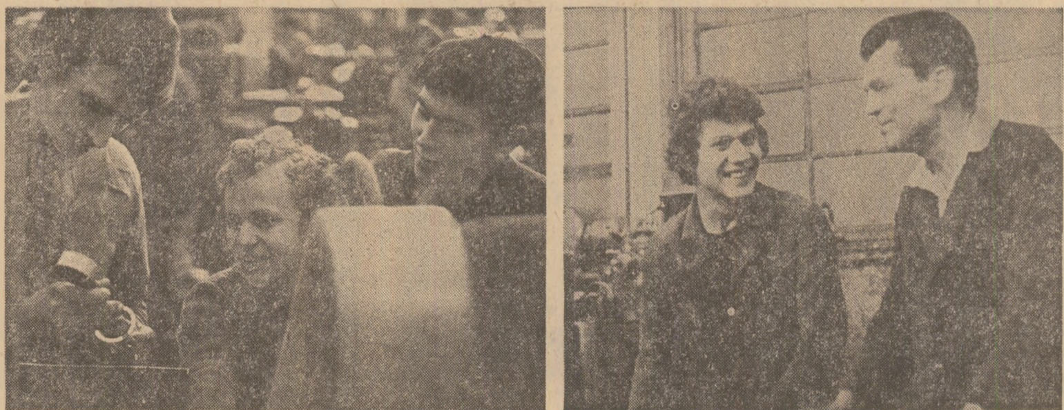
INSTANTANEE DE PE TRAIECTORIA UNEI VALOROASE ÎNȚINDERI ÎN ÎNȚINDEREA DE STRUNGURI DIN ARAD