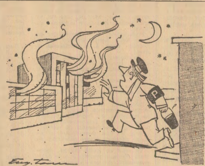
Nu anunț, că mă critică pentru neglijență... las' că soluționez eu singur cazul. Desen de Eugen TARU