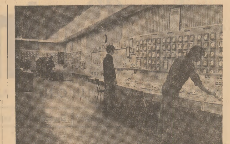
Camera de comandă de la centrala termoelectrică Brăila.

O dată la două-trei săptămîni, în perioada 30 martie—7 septembrie a.c., familiile D. și P. au putut fi văzute pe strălele instanțelor judecătorești din Capitală. Mai întîi, pe coridoarele și prin sălile de sedințe ale judecătoriei sectorului 7; apoi — prin cele ale Tribunalului Capitalei... Pricina? După ce au încheiat un contract