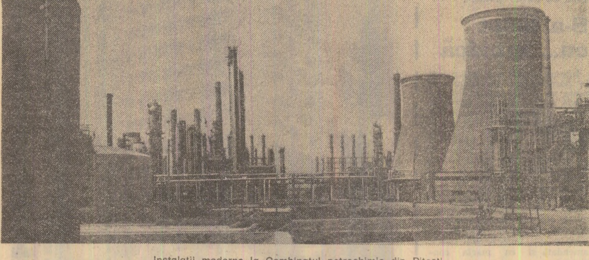
Instalații moderne la Combinatul petrochimic din Pitești

Gh. GRAURE Const. SOCI (Continuare în pag. a IV-a)