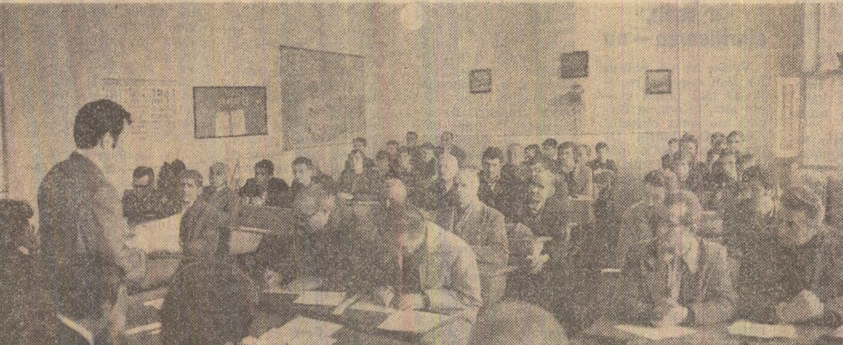
La adunarea alegătorilor din circumscripția electorală nr. 40, sectorul 6, din Capitală