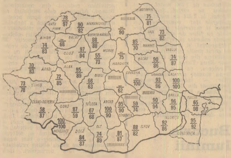
Cifrele înscrise în perimetrul fiecărui județ redau în procente suprafețele semăntate cu grîu la 18 octombrie a.c. în întreprinderile agricole de stat (sus) și în cooperativele agricole (jos)