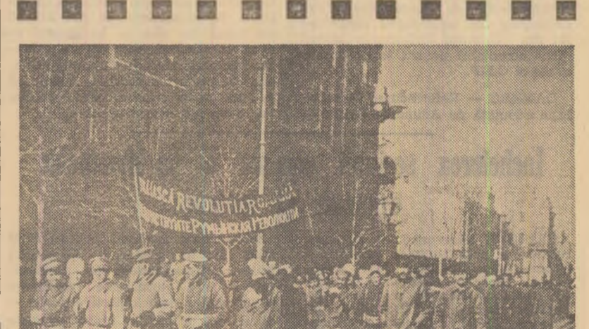
Batalion revoluționar român pe străzile Odesei