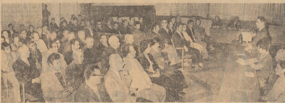
La întâlnirea cetățenilor cu candidatul lor din circumscripția electorală nr. 3, sectorul 3 din Capitală