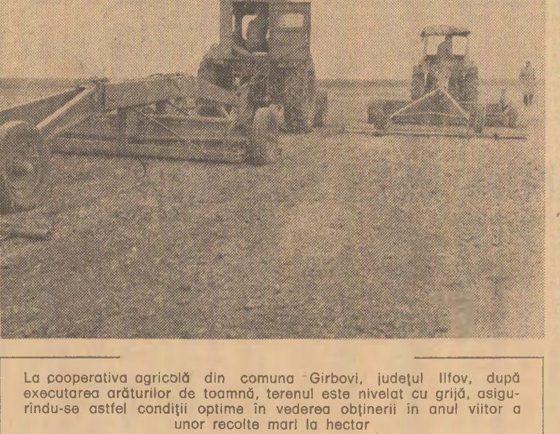
La cooperativa agricolă din comuna Gîrbovi, județul Ilfov, după executarea arăturilor de toamnă, terenul este nivelat cu grijă, asigurîndu-se astfel condiții optime în vederea obținerii în anul viitor a unor recolte mari la hectar

recolta poate crește foarte mult. Iată, pe scurt, măsurile aplicate. Pregătirea pentru cultivarea fasolei începe din toamnă, cînd se execută arăturile la adîncimea de 23-25 cm, concomitent efectuîndu-se erpantul și nivelatul. Pentru fertilizarea terenului se folosesc 60-80 kg îngrășămînt azotat și 80 kg fosfor (substanță activă), care se administrează însumat 632.000 lei, rîmînînd astfel un venit net de 364.000 lei. Este și motivul pentru care membrii acestei cooperative au cerut să dubleze suprafața cultivată cu fasole. Am prezentat mai pe larg experiența cooperativei agricole din Gîrbovi în ce privește cultivarea fasolei deoarece ea relevă pregnant că besea tot pot fi obținute asemenea