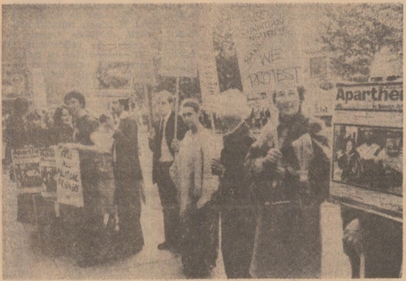
Măsurile represive adoptate de autoritățile rasiste sud-africane împotriva populației africane au stîrnit puternice proteste în lumea întregă. În fotografie: demonstrație de protest la Londra