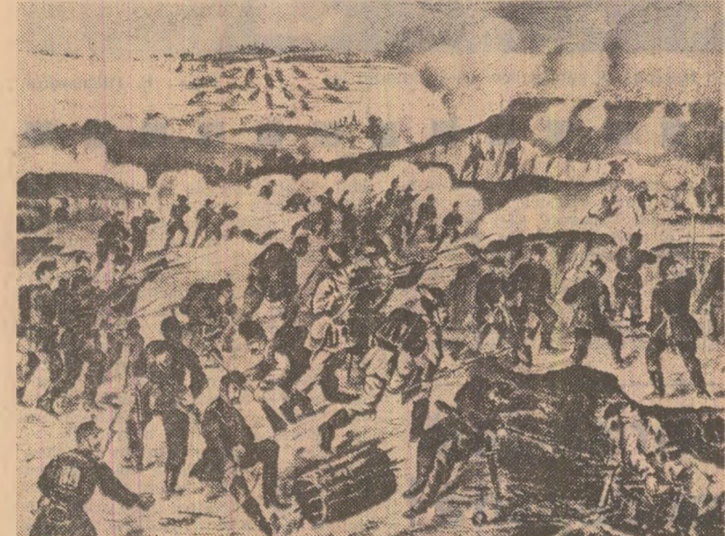
Atacul asupra cetății Rahova (7 noiembrie 1877)

Așezată pe malul drept al Dunării, în fața portului românesc Bechet — la circa 70 km nord-vest de Plevna — cetatea Rahova era un important nod de comunicații și în același timp și un punct de legătură între gruparea inamică de la Plevna și cea de la Vidin. Efectivul garnizoanei de aci număra aproximativ 3.000 de oameni. Sistemul defensiv al Rahovei consta în patru redute legate între ele prin sanțuri de apărare, pe un front de aproape 3 km. De altfel, însăși poziția geografică a