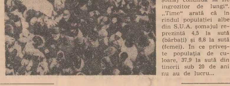
Fotografia alăturată, publicată de revista americană „Time” în numărul său din 23 noiembrie, înfățișează îmbulzeala produsă în fața întreprinderii „Western Electric” din Oklahoma, care a anunțat că are 58 de posturi libere.