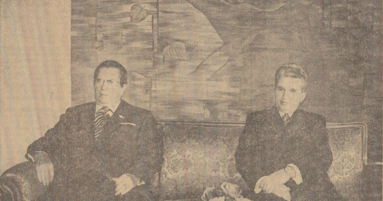
Moment din timpul convorbirilor