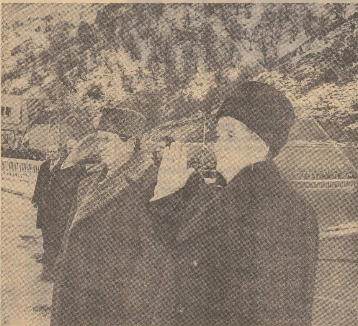
La încheierea vizitei de prietenie