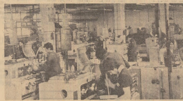
Într-una din secțiile întreprinderii de șuruburi din Botoșani

tute aproape că nu știați cui aparțin: constructorului sau beneficiarului. Cu trei zile înainte începerii lucrărilor Conferinței Naționale a partidului, constructorii și colectivul de oameni ai muncii de la Întreprinderea de șuruburi din Botoșani