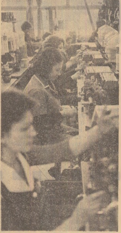
În secția bobinaj a întreprinderii „Electroaparatură” din Capitală

Este un meci istoric al Partidului Comunist Român de a fi reevaluat conviețuirea dintre oamenii muncii de diferite naționalități din țara noastră, unind într-un imens fluviu, al faptei creatoare, energiile degaștate prin acțiunile consistente ale solidarității revoluționare. Lucrările Conferinței Naționale a partidului au constituit o nouă și strălucită dovadă a unității ferme a tuturor oamenilor muncii de pe cuprinsul României. Succesele obținute în domeniul economic și social-cultural pe care le-au raportat în plen și în secțiuni participanții la discuțiile — români, maghiari, germani și de alte naționalități — sint o expresie elocventă a faptului că egalitatea în drepturi se realizează în primul rînd prin accesul egal la muncă, prin contribuția fiecăruia la dezvoltarea armoneică a societății noastre, prin dezvoltarea armonioasă a forțelor de producție pe tot teritoriul țării. Iar egalitatea în drepturi constituie una din premisele unității.