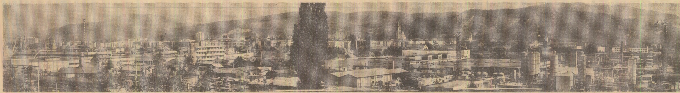
La Bistrița, REPUBLICA înseamnă dezvoltare. Bătrînele turnuri ale orașului, întrecute acum de mult mai semețele construcții industriale, rămîn ca martori în timp medîtină la adîncile prefaceri din structura economică și socială a acestor locuri