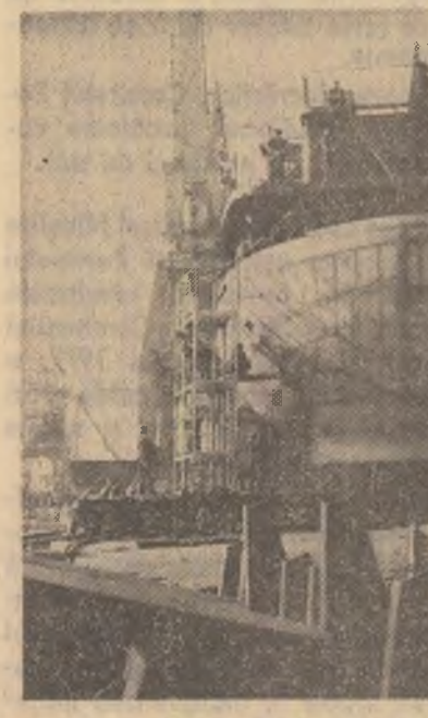
Santierul naval Oltenița. Se lucrează la montarea unei nave de 2.150 tone

Județul Bacău, de pildă, planul anual de investitiile destinate zootehniei sec-torului cooperatist a fost depășit. Este un rezultat pozitiv, roș al măsurilor inițiate de comitetul județean de partid încă din primăvara pentru definitivarea documentației tehnice, înlăturarea ritmică a prevederilor din graficele de executie, înlăturarea deficiențelor in asigurarea