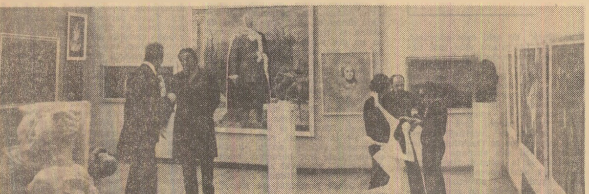
Deschiderea Salonului de pictură, sculptură și grafică al municipiului București