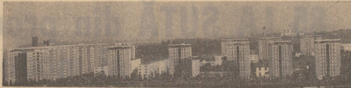
IN PAGINA A III-A

Anii Republicii au adăugat acestui izvor — melegurile băcăuane — limpezime, prospețime, forță