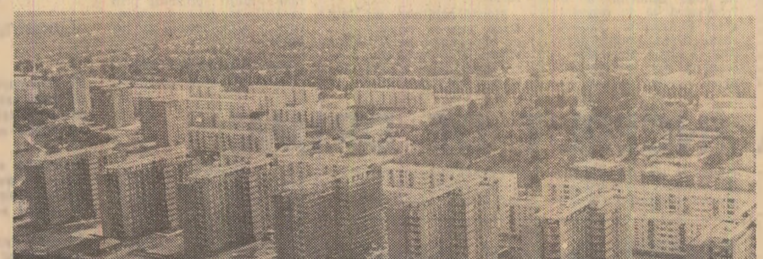
Bacău, cartierul Cornișa

● În ultimii ani, industria a devenit ramura de bază a economiei județului, realizând peste 67 la sută din produsul global.