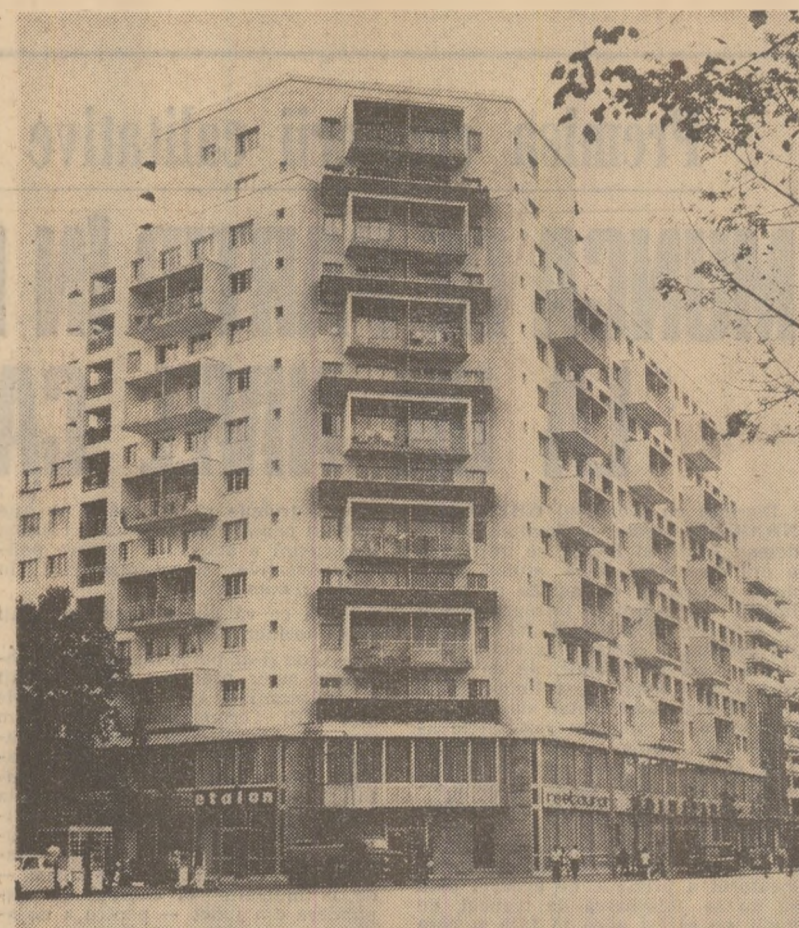
Calea Dorobanților din Capitală.

NICOLAE CEAUȘESCU Secretar general al Partidului Comunist Român Președintele Republicii Socialiste România