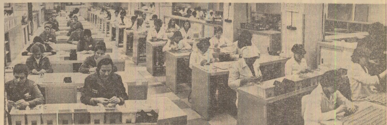
Meticulozitate și precizie: în secția montaj a Întreprinderii de mecanică fină din Capitală