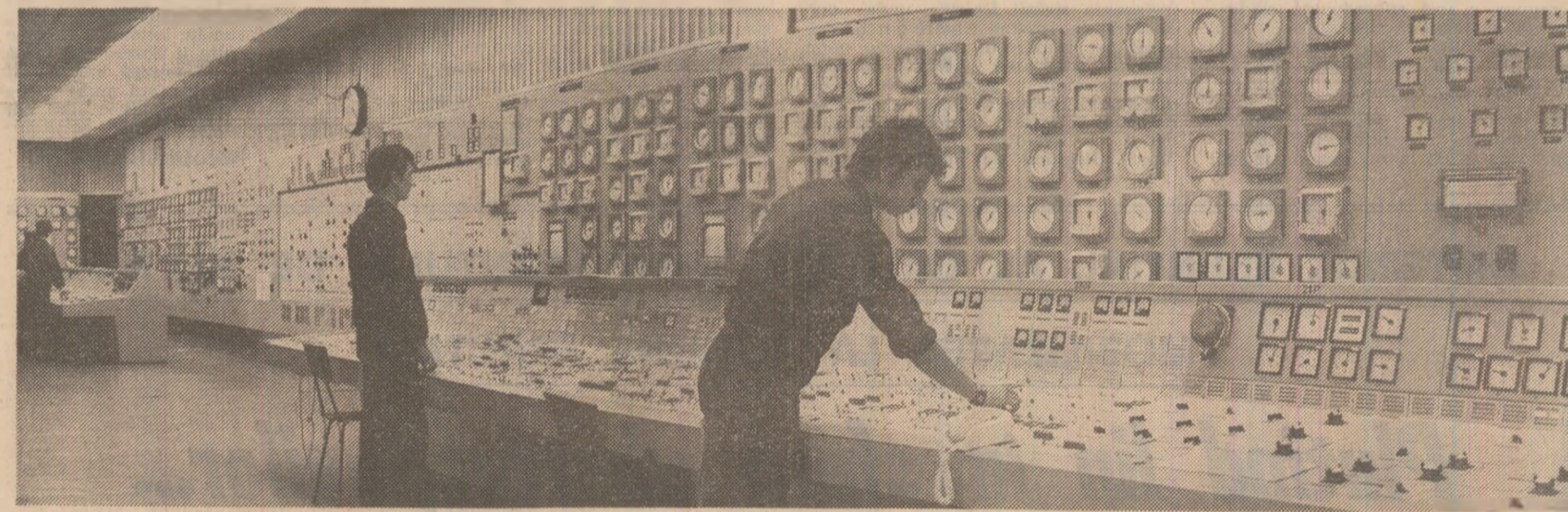
Termocentrala Brăila: sala de comandă termică

— Înregistrăm, an de an, o diminuare a consumurilor specifice de combustibil la producerea energiei electrice. Dacă comparăm rezultatele obținute anul trecut cu cele din 1973, constatăm o reducere de 12 grame combustibil convențional la fiecare kilowatt-ora produs, ceea ce reprezintă o economie de 672 milioane tone combustibil convențional. În acest al