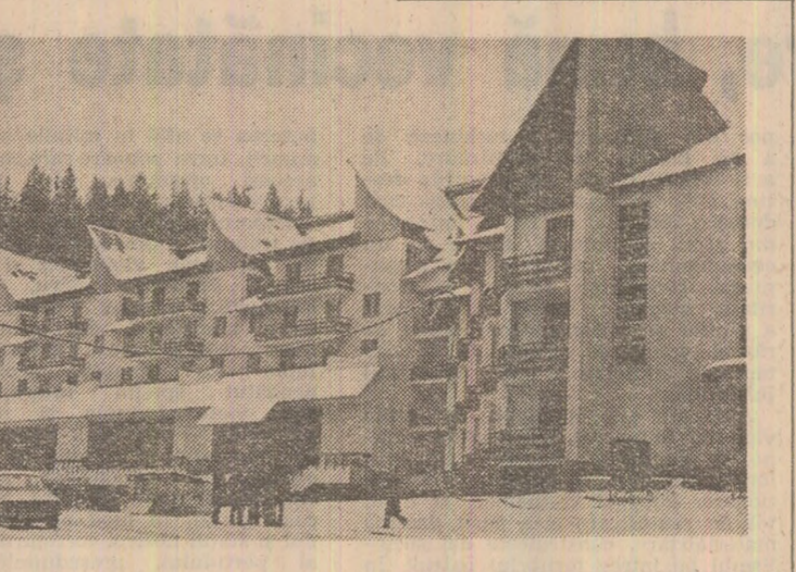
Un nou complex turistic la poalele Ceahlăului