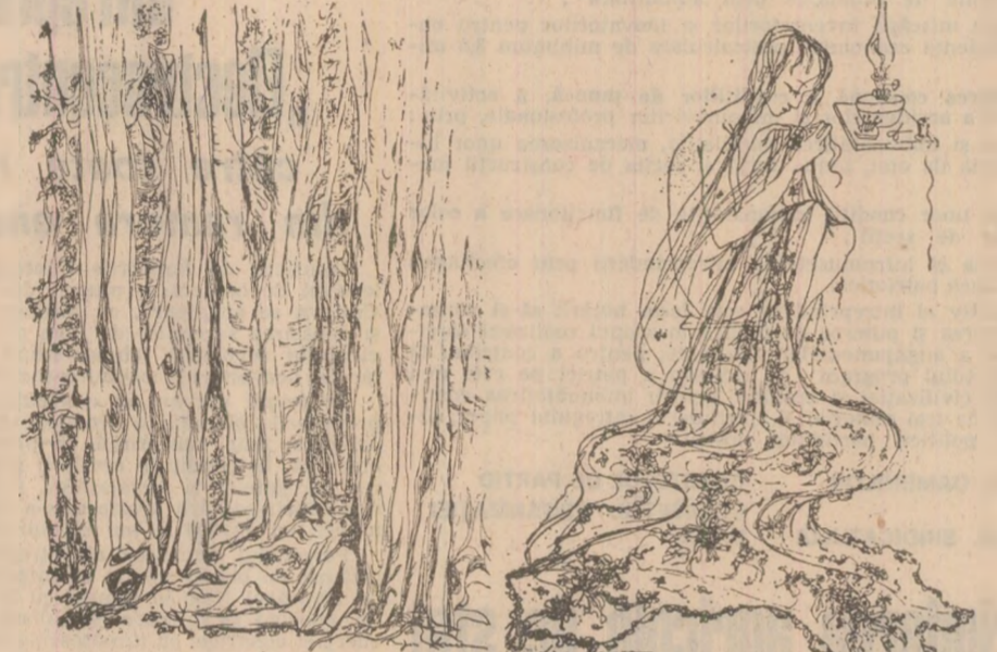
LIGIA MACOVEI: „Itinerar eminescian” (expoziție deschisă la Muzeul literaturii române): „Revedere” și „Viața”

Perpessicius, autorul acelor volume și al celor două tablouri ale poezilor antume și postume, publicate, respectiv, în Opere I și Opere IV) și pînă la indexii (de autori și de nume proprii din textul eminescian), toate se leagă între ele și toate — și răspund, gîndite cum sînt în strînsă conexiune și sub semnul unei unități de echipă solidă, strîns laolaltă de exemplul maestrului.