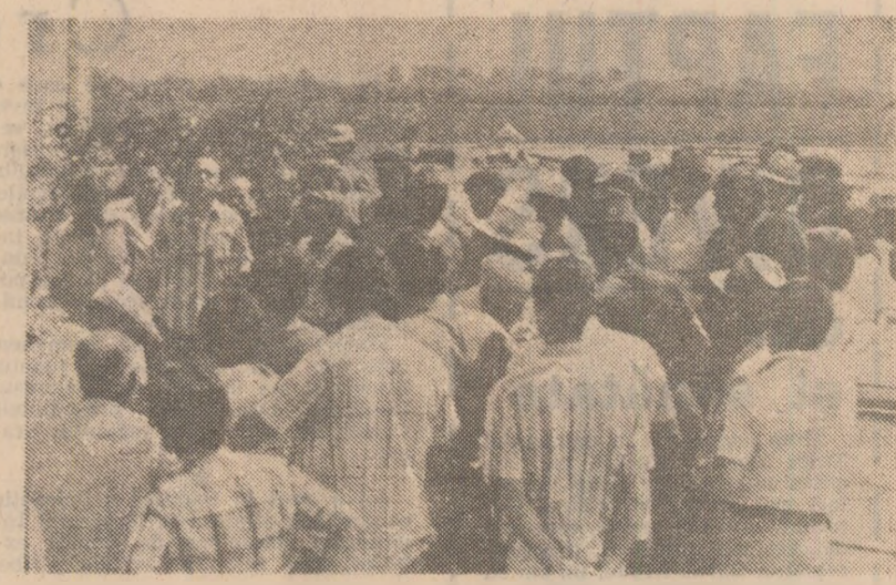
În cadrul proceselor profunde ce au loc în viața Spaniei, se face tot mai simțită mișcarea din rîndul păturilor tîrînești în vederea creării de organizații sindicale, pentru a putea face față presiunilor monopolice în sectorul agricol. Fotografia înfățișează o intrunire tîrînească în apropiere de Sevilla

CETATEA VATICANULUI 12 (Agerpres). - Ministrul de externe al Israelului, Moshe Dayan, care se află în vizită la Roma, a fost primit joi la Vatican de Papa Paul al VI-lea. Potrivit relațiilor agenției United Press International, s-a procedat la un schimb de vederi asupra viitorului relațiilor dintre cele două țări. În această privință, Dayan a informat pe papa că guvernul israelian nu are nici o intenție de a se retrage din teritoriile ocupate în Palestina și în Golan. În schimb, Dayan a afirmat că guvernul israelian este dispus să discute cu autoritățile vaticane probleme privind situația din Orientul Mijlociu.