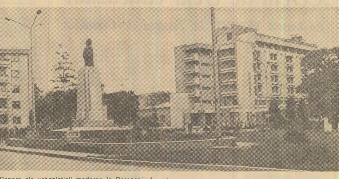
Reper ale urbanisticii moderne în Botoșani de azi