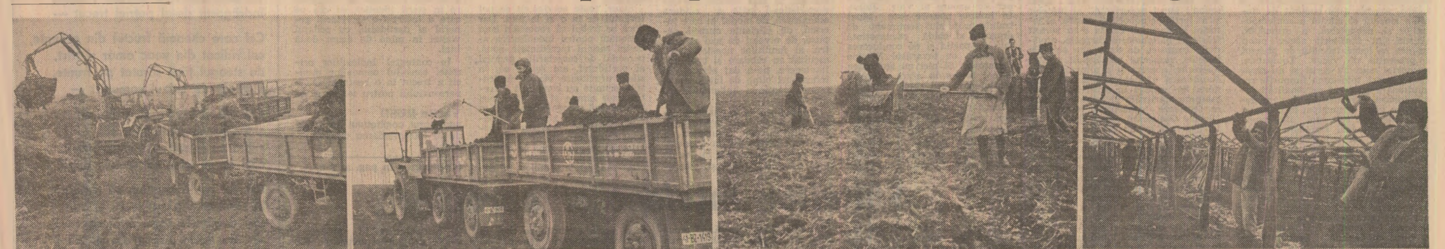
Iată câteva imagini sugestive de muncă, surprinse de obiectivul aparatului de fotografiat: mijloaca mecanizată folosită la transportul îngrășămintelor naturale - C.A.P. Gherăseni (prima fotografie); împrăștierea gunolului de grajd pe terenurile cooperative agricole Glodeanu-Siilștea (fotografiile nr. 2 și 3); repararea solarilor la C.A.P. Gherăseni (fotografia nr. 4)

Un bilant rodnic al acțiunilor întreprinse duminică, 15 ianuarie, pe ogoarele județului Buzău: 750 ha teren au fost fertilizate cu 12 000 tone îngrășămintelor organice și 1 000 tone îngrășămintelor azotoase; la circa 16 000 de pomi și 125 ha cu viță de vie au fost efectuate tăieri de rodire, 2 000 ha de pașuni naturale s-au curățat de arborei, pietre și mușuroare, s-au decontat și reparat 50 km de canale de desecare și irigații. La toate aceste acțiuni de masă, organizate din inițiativa comitetului județean de partid, au participat peste 60 000 de cooperatori, mecanizatori și alți locuitori ai satelor. - Complexitatea sarcinilor ce revin agriculturii județului nostru în acest al treilea an al cincinalului, înfăptuirea programelor de măsuri stabilite pentru fiecare cultură în vederea obținerii recoltelor pe care ne-am angajat să le realizăm în acest an, ne spună tovarășul Gheorghe Matiel, director-adjunct al direcției agricole județene - impune, așa cum ne-a cerut secretarul general al partidului, tovarășul Nicolae Ceaușescu, ca în agricultură activitatea să se desfășoare fără răgaz, încă din primele zile ale anului. Experiența celorlalți ani ne-a dovedit că în acest fel putem executa la timp și de bună calitate toate lucrările prevăzute. La indicația comitetului județean de partid, organizațiile de partid de la sate, organele agricole, consiliile populare, conducerea unităților agricole organiza-