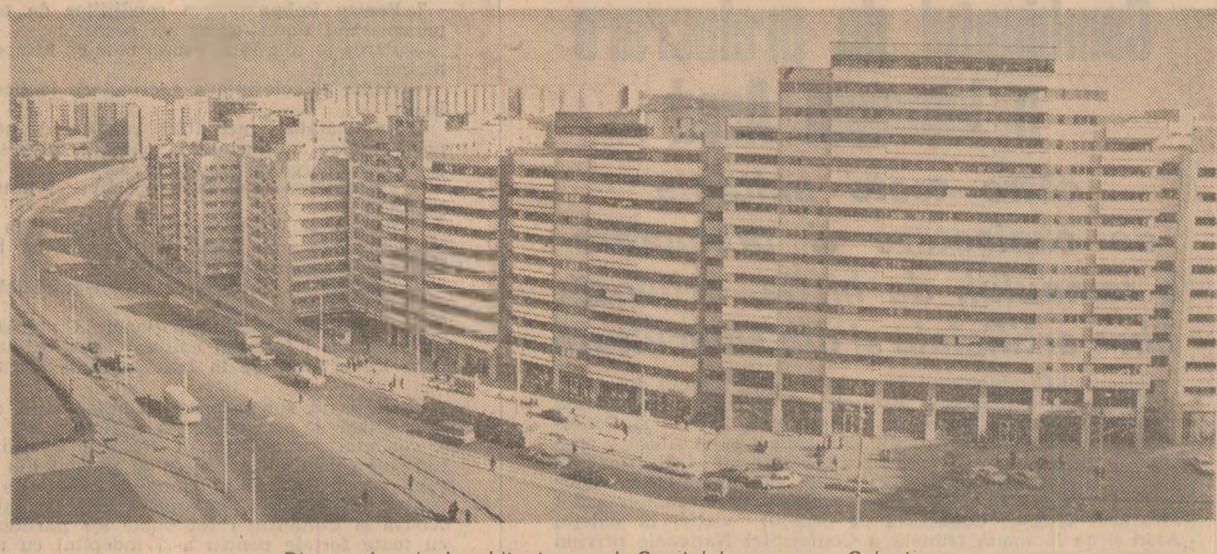
Din noul peisaj arhitectonic al Capitalei, șoseaua Colentina

IN ZIARUL DE AZI: ● RUBRICILE NOASTRE: Viața de partid; Răsfoind presa străină; De pretutindeni; Faptul divers