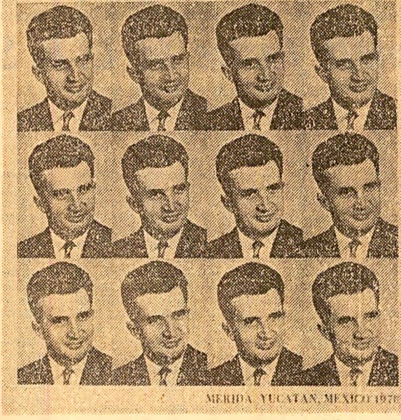
MERIDA YUCATAN, MEXICO 1978