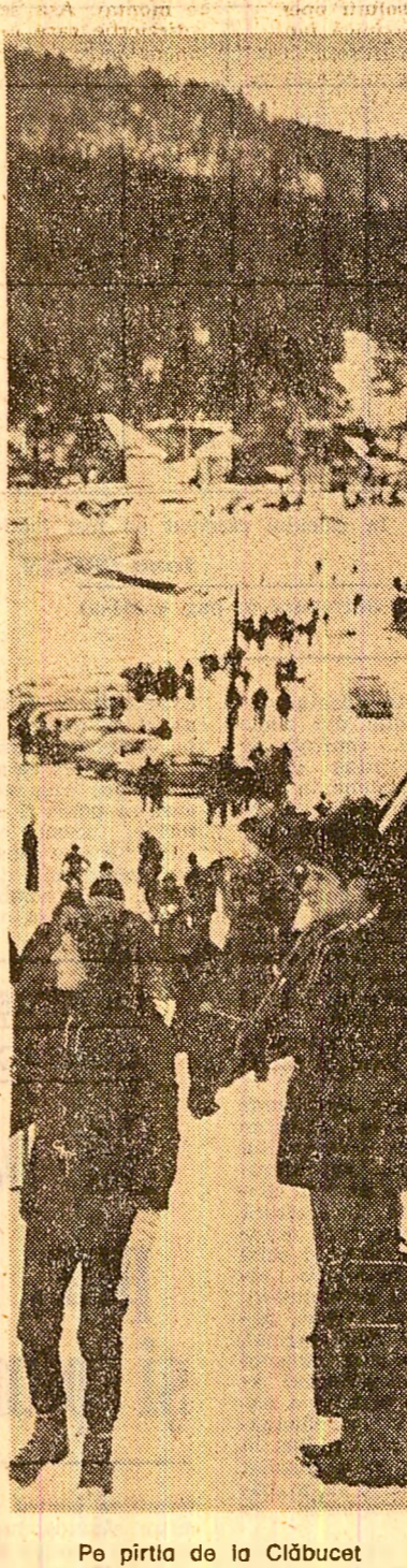
Pe pirtio de la Clăbucet