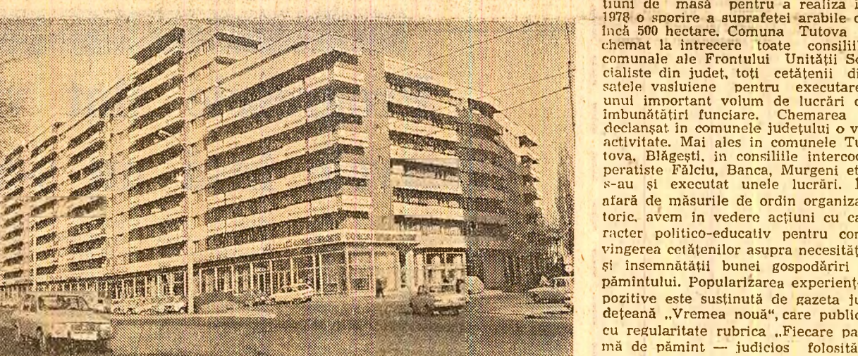
București: nolle dimensiuni ale construcțiilor de pe Bulevardul 1 Mai

În cuvîntarea tovarășului Nicolae Ceaușescu la Consfătuirea de lucru consacrată problemelor agriculturii din județ s-a subliniat în mod deosebit necesitatea bunel gospodării a pămîntului. Indicația ca toate unitățile agricole, toate consiliile populare comunale să ia în evidență și să pună în valoare întreaga suprafață agricolă are o mare însemnătate și pentru județul Vaslui, unde mare parte din terenuri sînt degradate, situate pe dealuri sau pe văi mălinoase. Comitetul județean de partid a elaborat și aprobat un program de îmbunătățiri funciare la baza căruia stau indicațiile date de tovarășul Nicolae Ceaușescu cu pri-