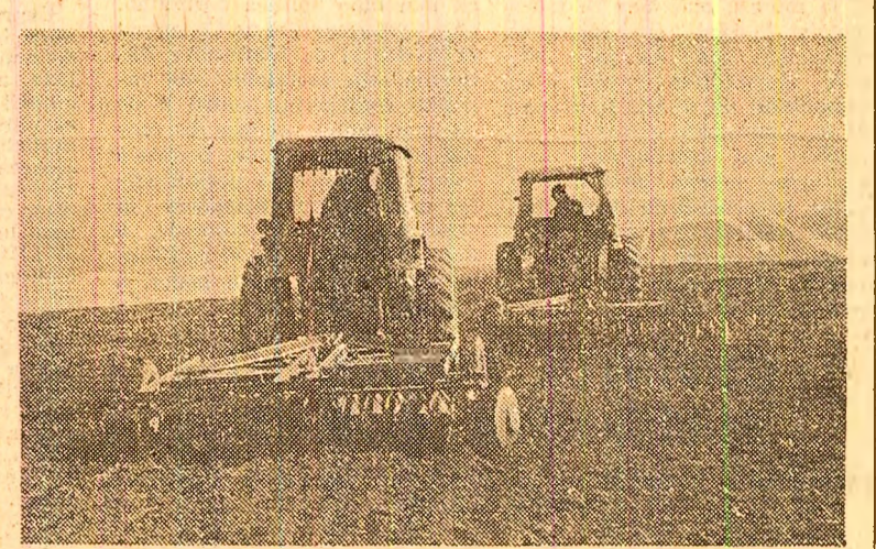
Odată cu îmbunătățirea vremii, la cooperativa agricolă Turda Nouă, județul Cluj, se lucrează intens la pregătirea terenului pentru însămînțarea secției de zahăr

În cadrul programului ce vizează realizarea unor schimbări calitative în structura producției, în industria metalurgică au fost elaborate metode superioare de oțeluri destinate fabricării de rulmenți, arcuri, țevi trase la rece, profile extrudate, sortimente care, prin performanțele lor ridicate, asigură o valorificare superioară a metalului. Acestor realizări li s-a alăturat, recent, introducerea în producție, la Combinatul de oțeluri speciale din Tîrgoviște, a oțelului înalt aliat cu molibden pentru fabricație de scule aschietoare cu randamente sporite. Conceput de specialiștii Institutului de cercetări metalurgice, în colaborare cu cei ai uzinei țirgoviștene, oțelul cu molibden prezintă caracteristici superioare sovietice, folosită pînă acum în același scop. Utilizat, în special, în producția de burghie și freze, el are o rezistență sporită la uzură și posibilități de prelucrare mai ușoară. De asemenea, costul unei tone de oțel cu molibden este mai redus cu circa 20 000 lei. (Agerpres).