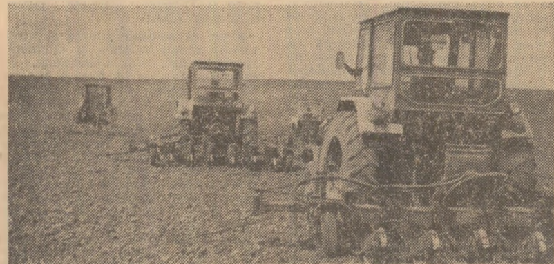
La Arpașul de Jos se seamănă ultimele suprafețe din culturile din epoca întâi

Președintele Republicii Socialiste România, t o v a r ă ș u l Nicolae Ceaușescu, a primit în ziua de 8 a-