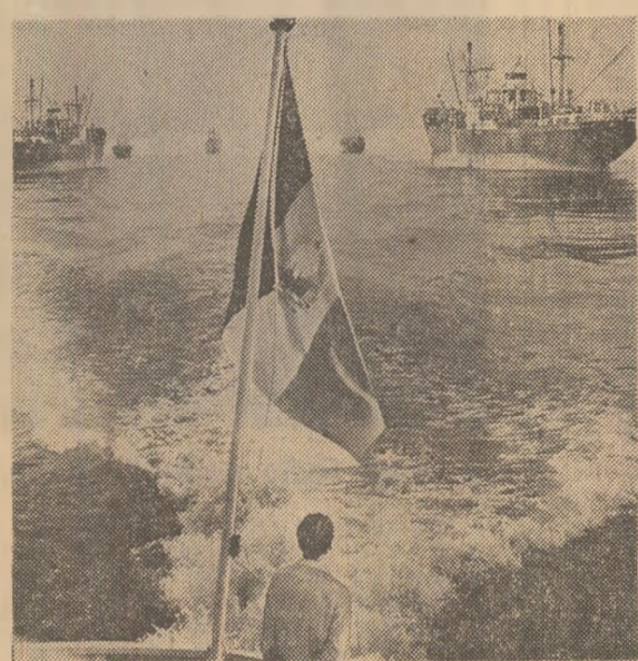
Reportaj de Radu TUDORAN