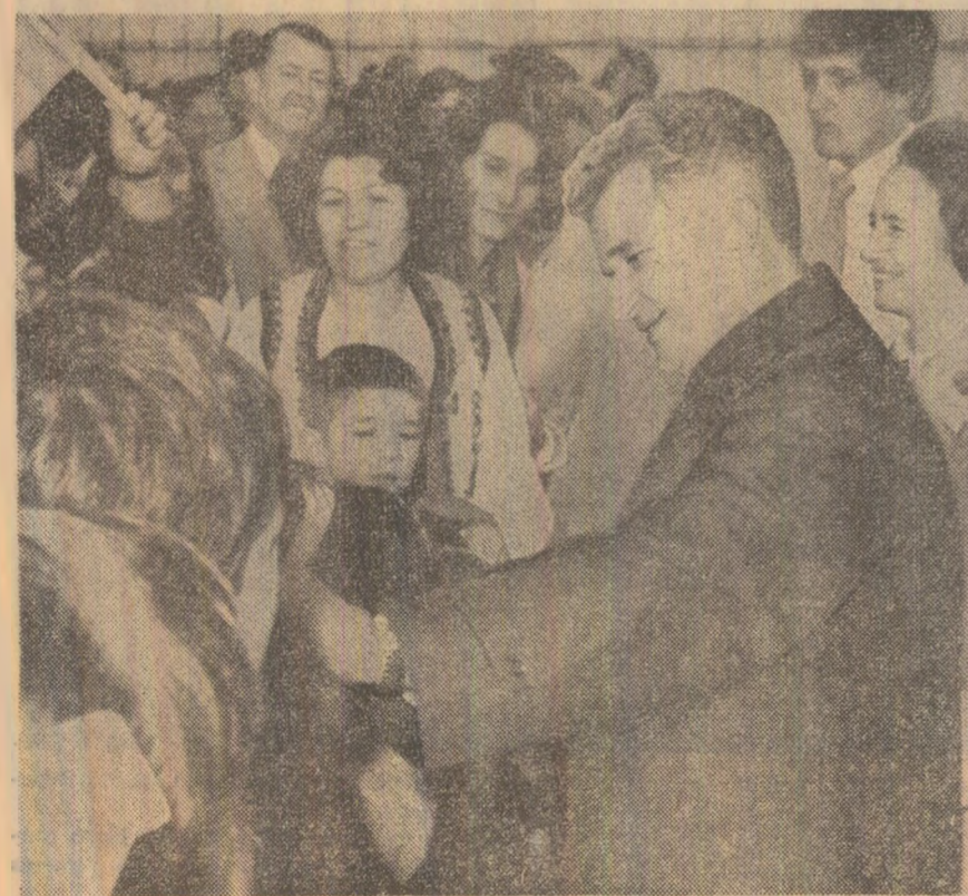
Primire deosebit de călduroasă pe aeroportul „J. F. Kennedy” din New York