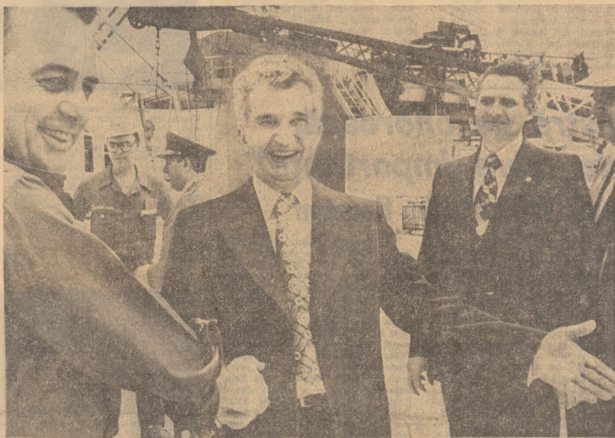
În mijlocul petroliștilor de pe platforma de foraj din Golful Mexic

(Din toastul rostit de președintele Nicolae Ceaușescu cu prilejul recepției și dineului de la New Orleans).