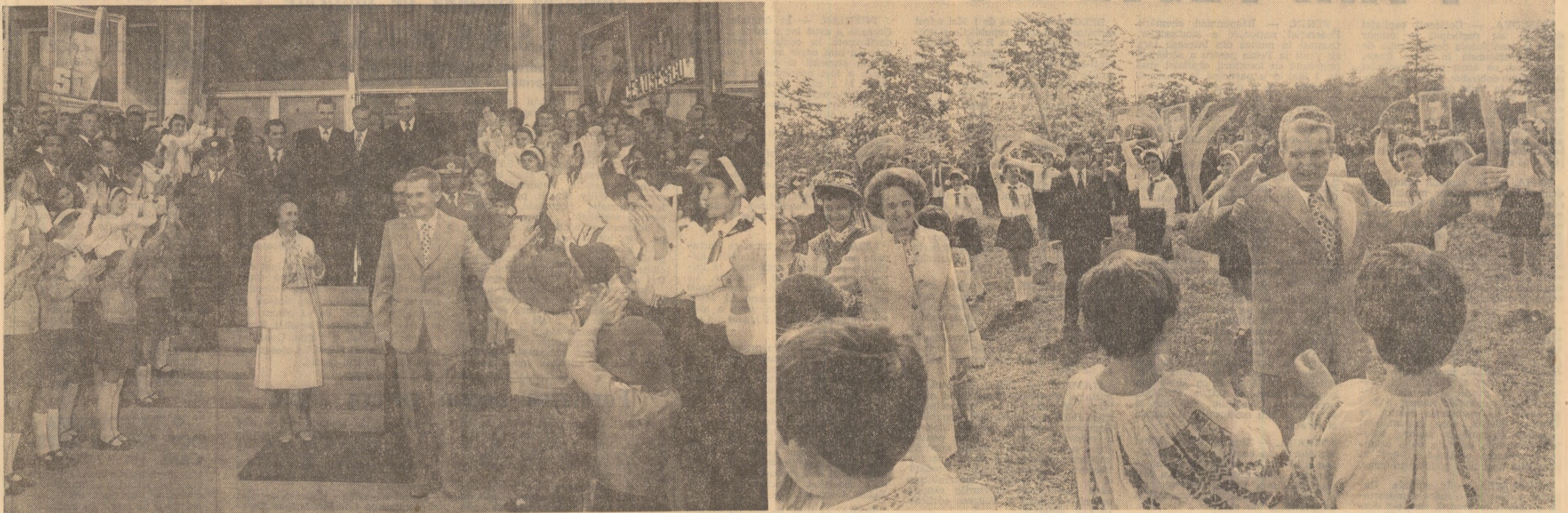
Calde manifestări de dragoste și stimă