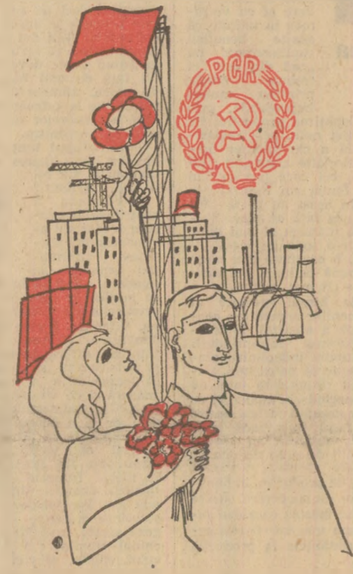
Desen de TRAIAN VASAI