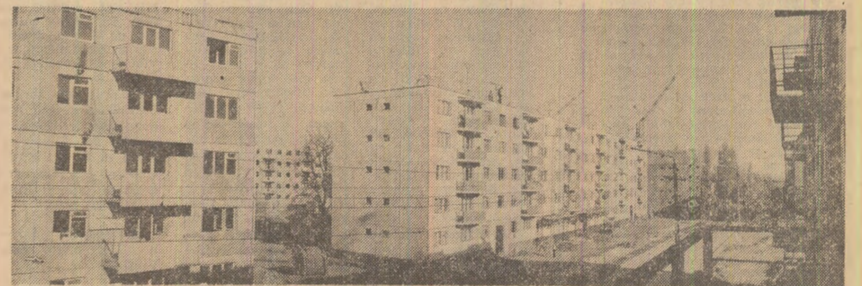
Bună parie din fondul localiv al orașului Zimnicea a fost distrus de cutremur. Acum, această localitate situată pe malul Dunării este un vast sanctor. Se înalță aici un oraș nou, modern, care contrastează cu aspectul rural de odinioară...