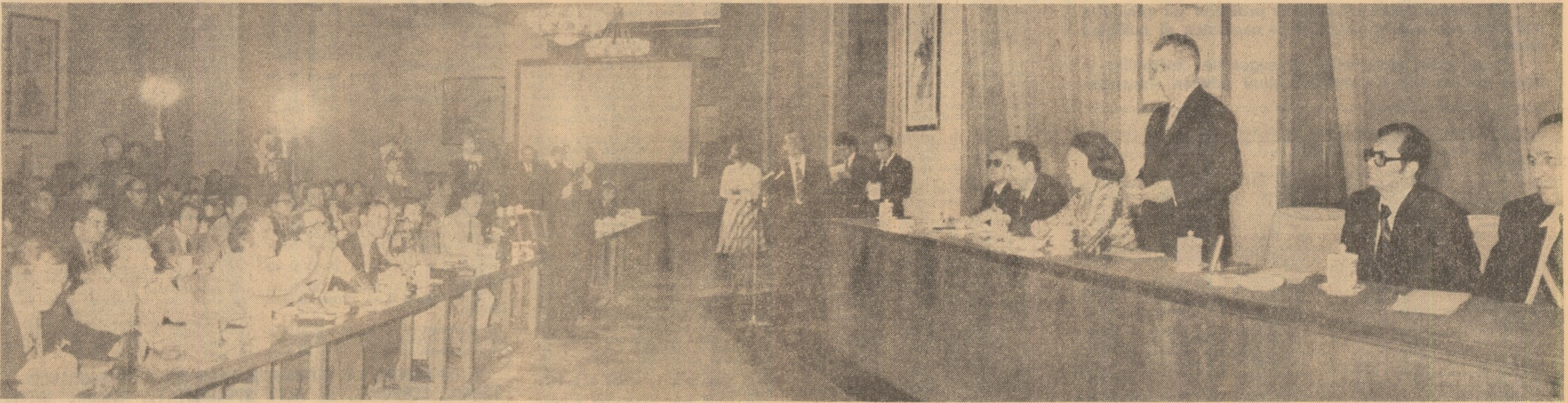
În timpul conferinței de presă