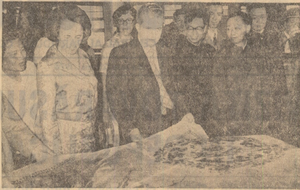
Înalții oaspeți apreciază calitatea țesăturilor la întreprinderea din Hangiou

Oprindu-se pe Podul Cien Ten — care traversează fluviul Cien Tien-fian, ce își poartă apele la poalele culmii pe care se află construită „Pa-