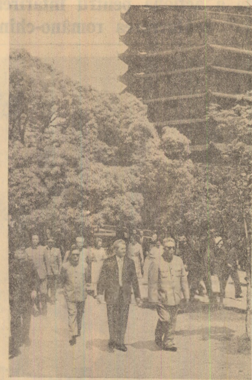
În vizită la „Pagoda celor șase armonii”

După ceremonia semnării în așlutezele celor prezenți tovarășii Nicolae Ceaușescu și Hua Kuo-fen și-au strîns îndelung minile, s-au îmbrățișat cu căldură.