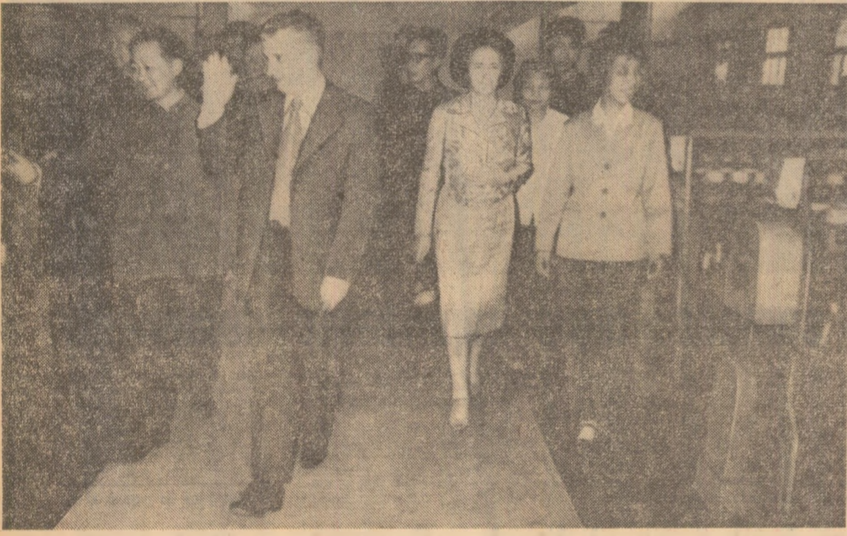
La întreprinderea de mătăsuri din Hangiou

În încheierea solemnității, tovarășii Nicolae Ceaușescu, tovarășa Elena Ceaușescu și tovarășii Hua Kuo-fen, ceilalți tovarășii din componența delegației de partid și de stat a celor două țări au ciocnit o cupă de sampanie.