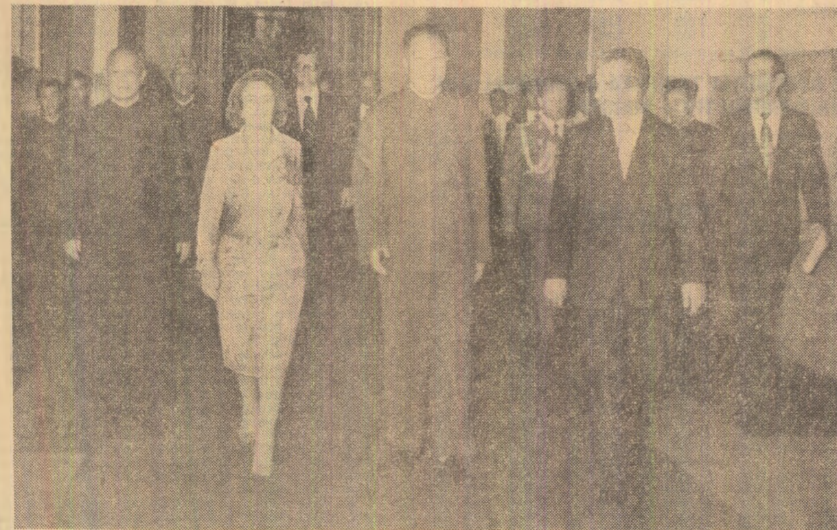
După încheierea convorbirilor oficiale

RĂSPUNS: După cum știți, China și Uniunea Sovietică întințesc relații diplomatice, iar în momentul de față se desfășoară tratative între reprezentanții chinezi și sovietici la Pekin. Este de înțeles că problemele dintre aceste două țări trebuie soluționate de către ele însele. După cum este cunoscut, România s-a pronunțat întotdeauna pentru soluționarea politică a problemelor și dorim ca aceasta să ducă la normalizarea și dezvoltarea relațiilor. Aceste probleme nu pot fi însă soluționate decît de către cele două țări, direct.