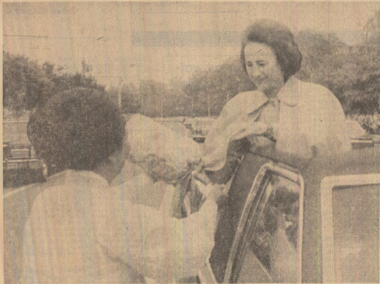
Flori ale stimei și prieteniei

și perspectivele etapei actuale a edificării societății socialiste. Tovarășii Nicolae Ceaușescu și Kim Ir Sen au relevat cu satisfacție evoluția pozitivă a relațiilor de prietenie și conlucrare multilaterală dintre Partidul Comunist Român și Partidul Muncii din Coreea, dintre Republica Socialistă România și R.P.D. Coreeană, dintre cele două popoare, în conformitate cu prevederile și principiile înscrise în Tratatul de prietenie și colaborare dintre cele două țări. Convorbirile au evidențiat, totodată, hotărîrea comună de a întări colaborarea dintre partidele și statele noastre, de a amplifica și ridica pe o treaptă superioară îndeosebi cooperarea economică și tehnico-stiințifică, coresponsizător cerințelor progresului general al celor două țări, în interesul accelerării propășirii celor două popoare pe drumul socialismului. Convorbirile se desfășoară într-o atmosferă de caldă prietenie și înțelegere tovarășească.