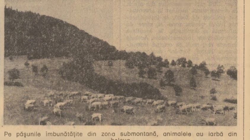
Pe pășunile îmbunătățite din zona submontană, animalele au iarbă din belșug