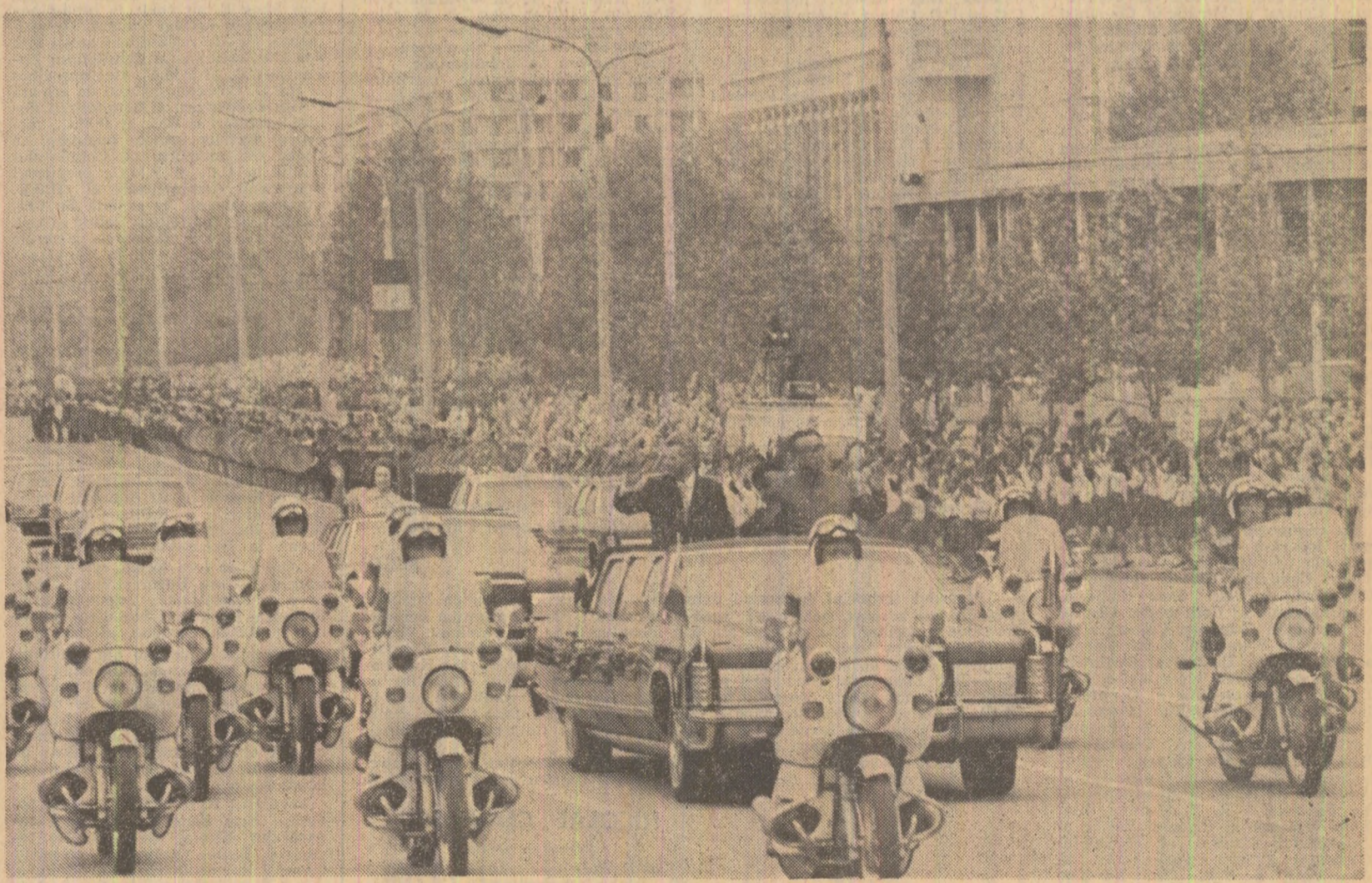
Locuitorii Phenianului au adresat un călduros și vibrant „Bun venit!” înalților soți ai poporului român

a Guvernului Kampuchiei Democratice, o vizită oficială de prietenie în această țară, la sfîrșitul lunii mai 1978.