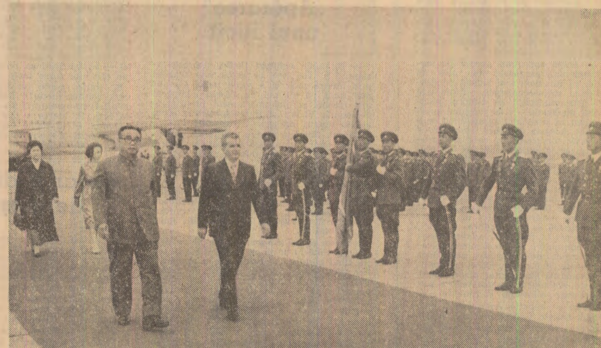
La sosirea pe aeroportul din Phenian