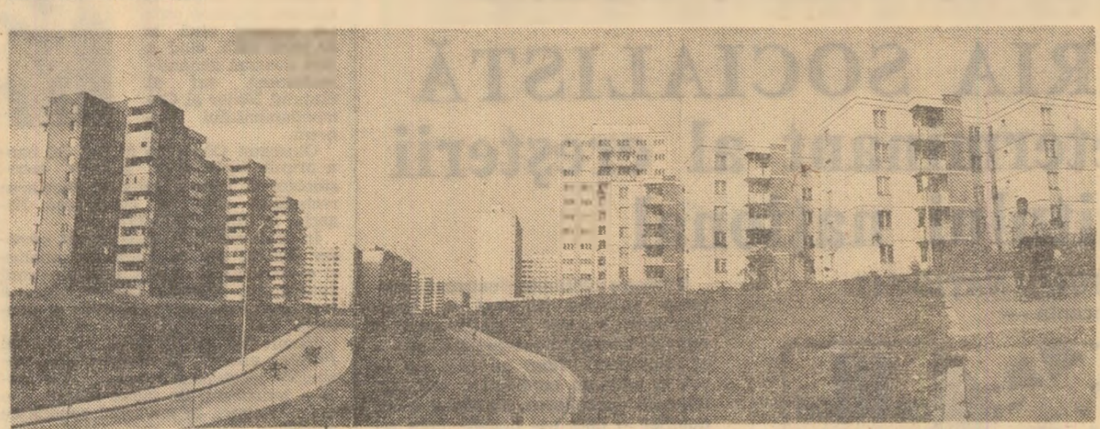
Nol construcții de locuințe în cartierul „Drumul Pietros” din Tg. Mureș.

rea bugetelor comunelor subvenționate. „Nu spun că județul nu veghează asupra cheltuiilor raționale a fondurilor acumulate — afirmă primarul Cobadinului, Dar apar totuși unele anomalii. De pildă, consiliul popular contribuie anual la bugetul județului cu peste 200.000 lei, reprezentând contribuția unităților economice de pe teritoriul comunei la întreținerea drumurilor. Normal ar fi fost ca acești bani să se reinvoare în comună sub formă de fonduri planificate pentru întreținerea drumurilor. Dar nu s-a întâmplat așa. Cel puțin în cazul comunei noastre, secția de drumuri a consiliului popular județean a „uitat” mereu în ultimii ani să includă în plan fonduri pentru lucrările de modernizare și „întreținere” din comuna Cobadin. Dacă acești bani ar rămâne la dispoziția comunei și noi am hotărâ cum să-i folosim — prin contracte ferme cu întreprinderile de