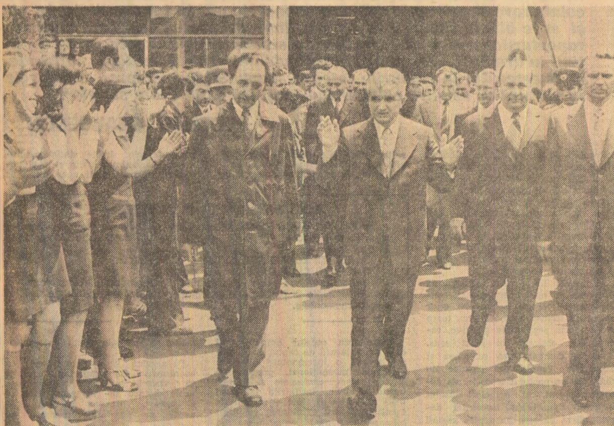
Primire călduroasă, entuziastă la întreprinderea de motoare electrice