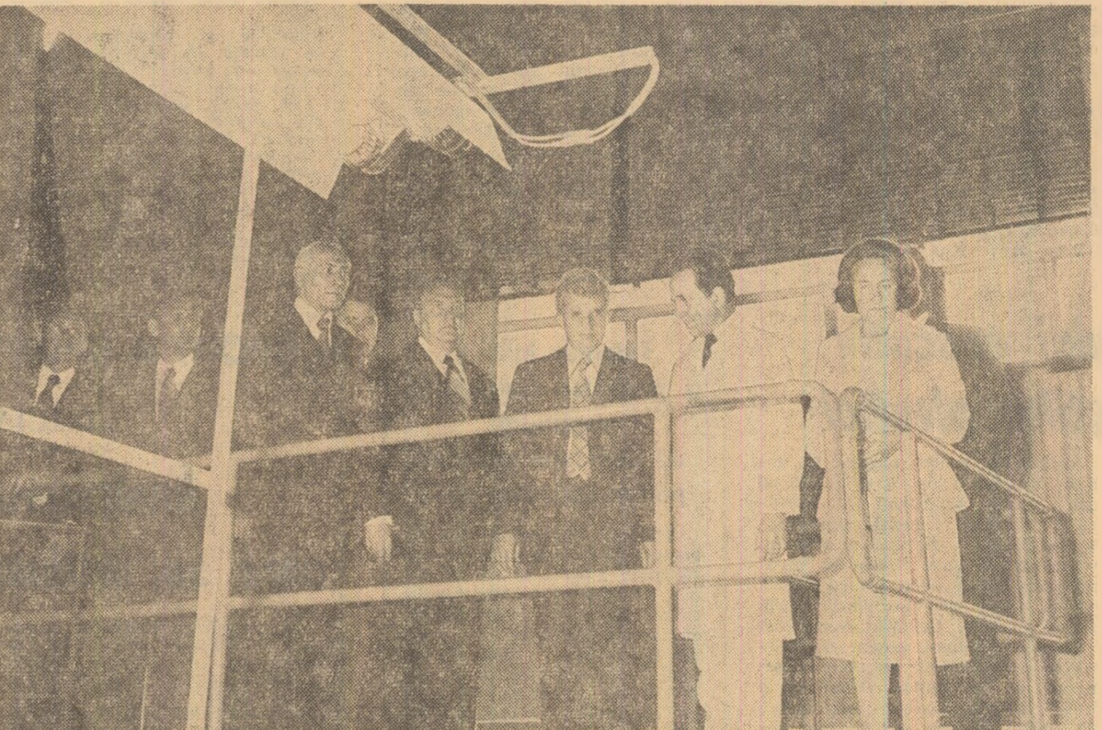
Sînt prezentate ultimele realizări ale Fabricii de cinescoape

Această nouă vizită de lucru a secretarului general al partidului, solidă cu concluderi de o deosebită însemnătate pentru dezvoltarea și modernizarea activității întreprinderilor și ramurilor economice care au făcut obiectul analizei, se încheie în atmosfera entuziastă care a caracterizat întreaga ei desfășurare. Mii de muncitori de la întreprinderile marii platforme industriale, ca și cei de la celelalte unități vizitate în această zi, aplaudă îndelung, ovacionează cu însufletire, exprimîndu-și bucuria de a-și fi avut din nou în mijlocul lor pe tovarășul Nicolae Ceaușescu și tovarășa Elena Ceaușescu, voința lor fermă de a înfăptui neabătutele sarcinile ce le revin din hotărârile Congresului al XI-lea și Conferinței Naționale ale P.C.R., recunoștința lor fierbinte față de conducerea partidului, pentru tot ceea ce face în scopul dezvoltării economice-sociale rapide a țării, înfiorii patriei și creșterii prestigiului României socialiste în lume.