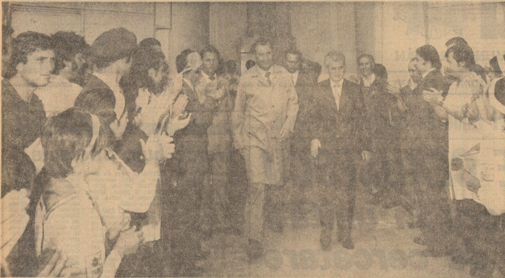
Prețurzeni, tovarășul Nicolae Ceaușescu l se face o primire entuziastă