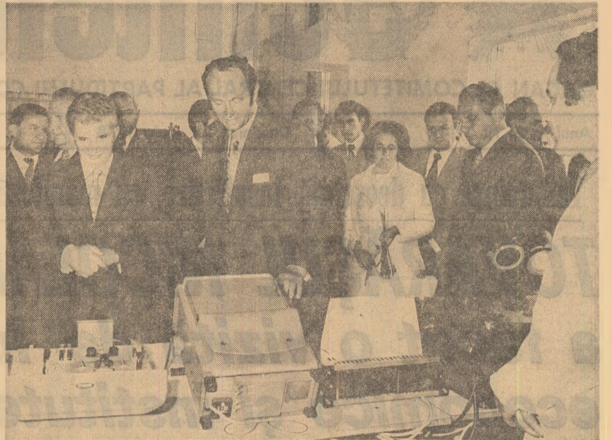
În fața unora dintre realizările de prestigiu ale specialiștilor, de la Institutul național de motoare termice