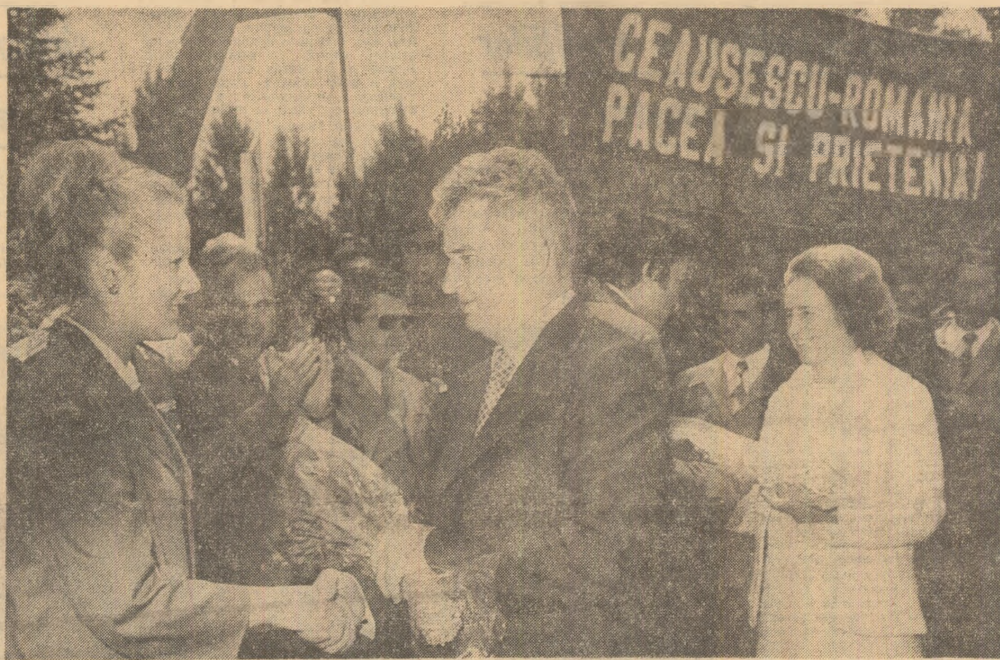
Călduroasa primire făcută tovarășului Nicolae Ceaușescu, tovarășei Elena Ceaușescu la Întreprinderea de reparat material aeronautic, expresie vie a simțămîntelor de oaleasă dragoste și stimă

● În toate unitățile vizitate, prețioasele indicații ale tovarășului Nicolae Ceaușescu au fost primite cu cel mai viu interes, cu hotărîrea fermă de a le transpune în viață, asigurînd astfel un progres neîntrerupt muncii în domeniul producției și cercetării