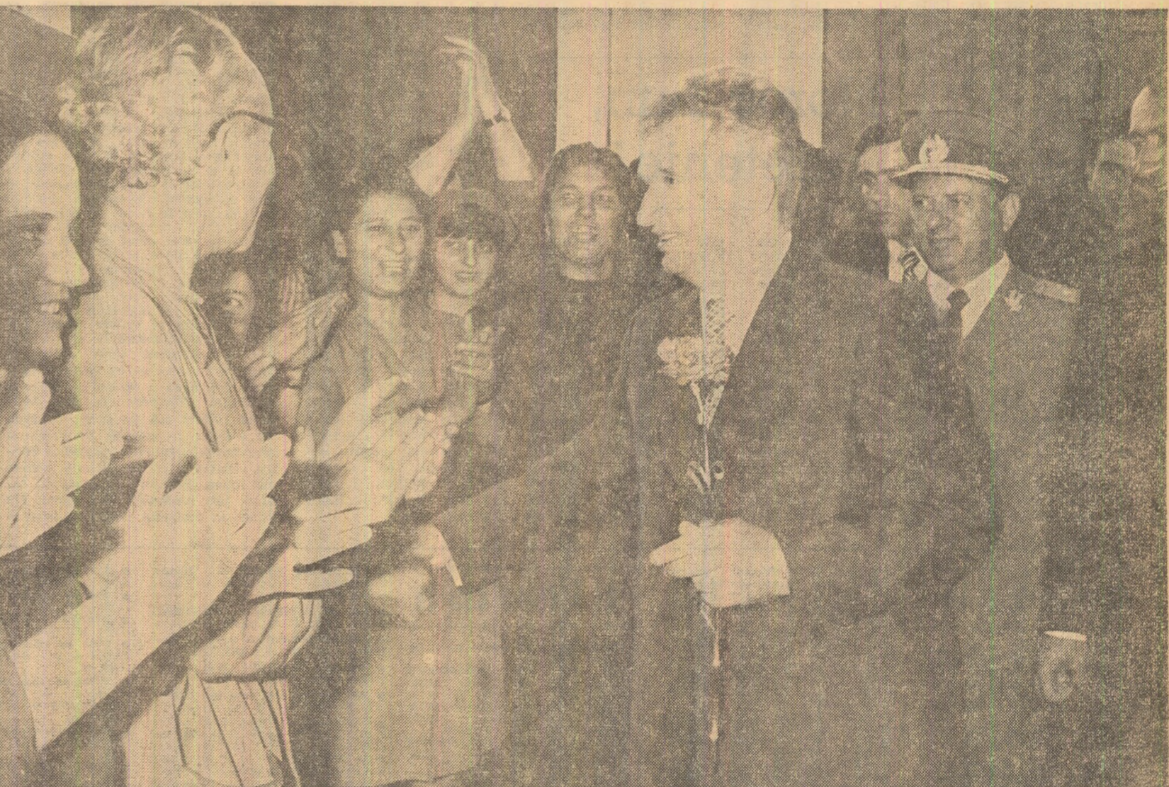
Pretutindeni, pe parcursul vizitei, aceeași atmosferă entuziastă, sărbătorească