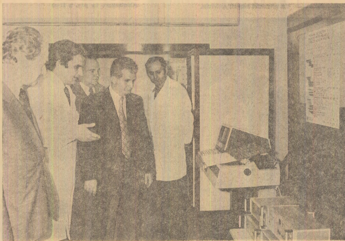
Sînt înfățișate cele mai recente calculatoare cu largi aplicații în diverse ramuri industriale