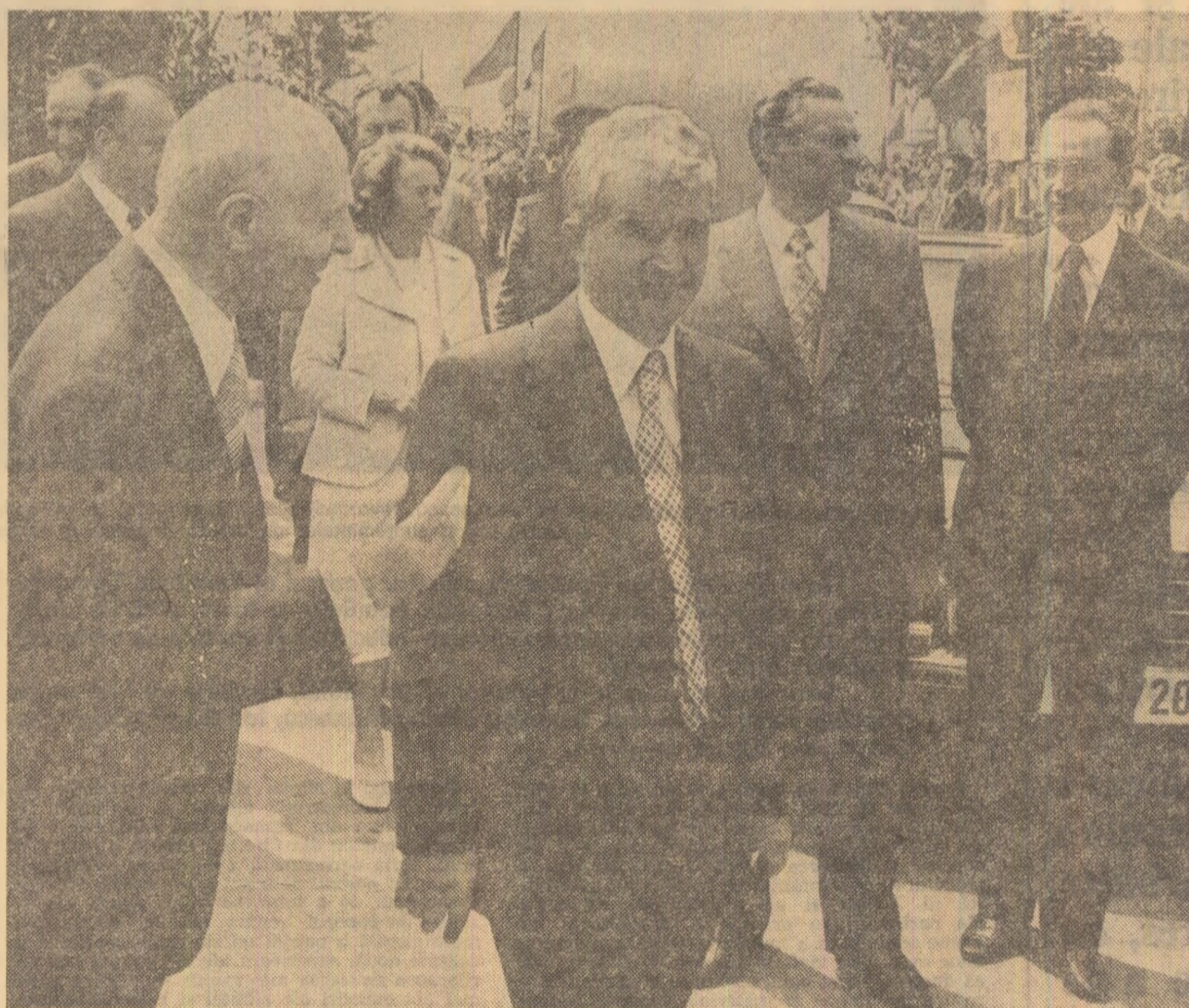
La Institutul de mecanica fluidelor și construcțiilor aerospațiale

cetarea și proiectarea în domeniul aeronauticii, al construirii de nave aeriene de transport și utilitare, să adăncească cercetările fundamentale în domeniile aerodinamicii și structurilor de avion. În acest scop, aici a fost creat un colectiv de specialiști cu o înaltă calificare și o modernă bază tehnico-materială.