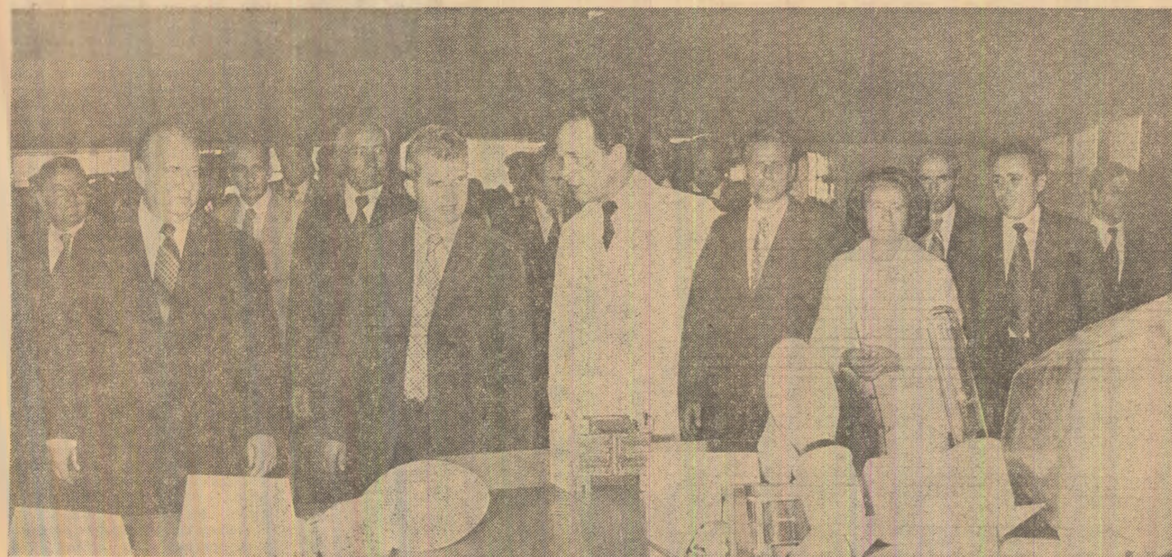
La Fabrica de cinescoape sînt examinate produse noi