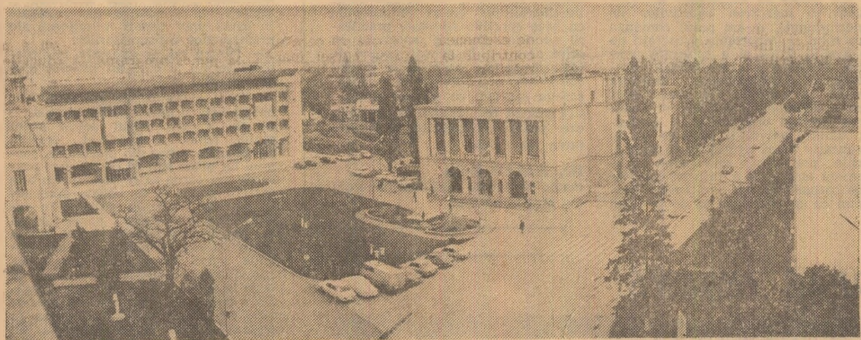
Arhitectură nouă, modernă în vechiul Botoșani