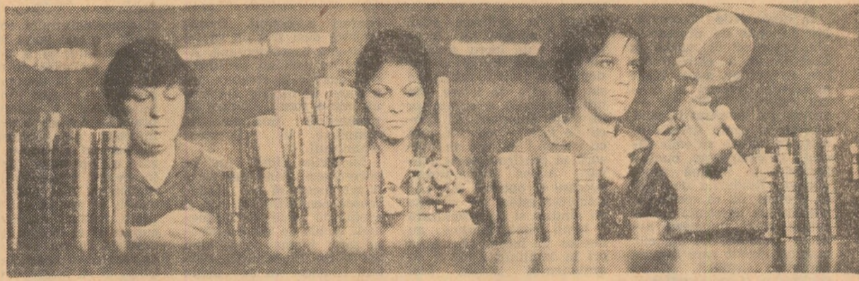
Întreprinderea de rulmenți Alexandria. Controlul calității produselor — o activitate de mare răspundere

ză evoluția lucrărilor de pe șantierul marelui combinat din Tulcea? Înainte de toate, necesitatea îndeplinirii cu rigurozitate a tuturor programelor de acțiune stabilite în totuși de către constructori, montori, beneficiari și furnizori de utilaje. Adoptarea lor s-a făcut în urma unor temeinice și realiste analize privind capacitatea și potențialul de care dispune fiecare dintre acești factori. Revizuirea înregistrat în ultimul timp vine să confirme o dată în plus realismul acestor măsuri, cit și capacitățile tuturor celor angajați în realizarea acestor măsuri.