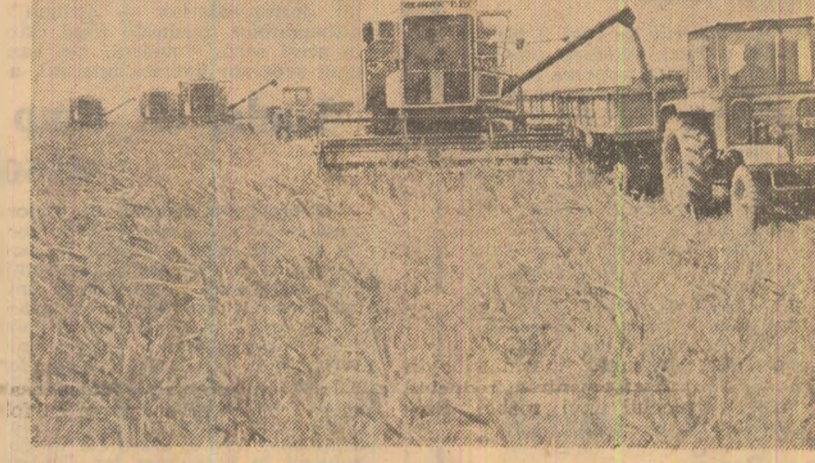
Seceriș în Bărăgan În pagina a III-a: În județul Ialomița: Organizarea secerișului — bună! Dar poate și trebuie să fie foarte bună!