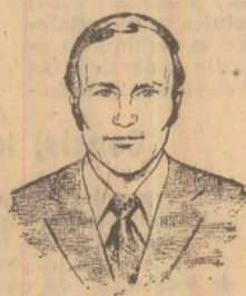
Ștefan DINICA Desen de T. ISPĂS