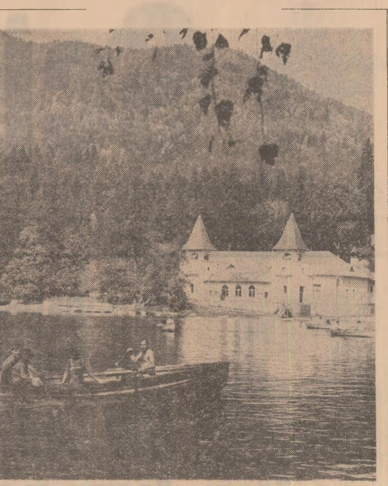
Concediu în frumosul decor al munților

executiv al Consiliului popular municipal nr. 698 din 1974 — întreprinderii de salubritate nu i-au mai rămas de făcut decît trei lucruri : colectarea și evacuarea gunoailor de la populație, instituirea și unității economice ; organizarea rampelor de depozitare a gunoailor menajere și industriale a pămîntului, molozului etc. ; asigurarea utilajelor necesare administrațiilor domeniului public din sectoarele Capitalei, pentru curățirea străzilor. Să vedem acum