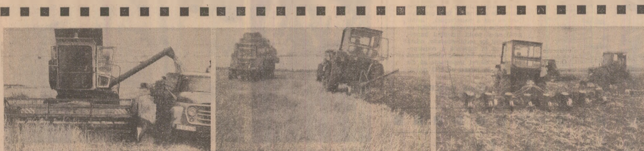
La C.A.P. Ulmu — Brăila, transportul grîului la bazele de recepţie se face direct din buncărul combinelor (fotografia din stînga). După combine au intrat imediat presele, apoi camioanele şi remorcile care au eliberat terenul.