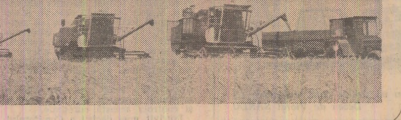
Paralel cu măsurile luate în vederea intensificării secerii, organele județene de partid și de stat, conducerea unităților agricole au dator să asigure transportarea accelerată a cerealelor recoltate, precum și livrările la fondul de stat.

Paralel cu măsurile luate în vederea intensificării secerii, organele județene de partid și de stat, conducerea unităților agricole au dator să asigure transportarea accelerată a cerealelor recoltate, precum și livrările la fondul de stat. Din datele existente la centrala de specialitate rezultă că în unele județe, chiar din cele fruct-