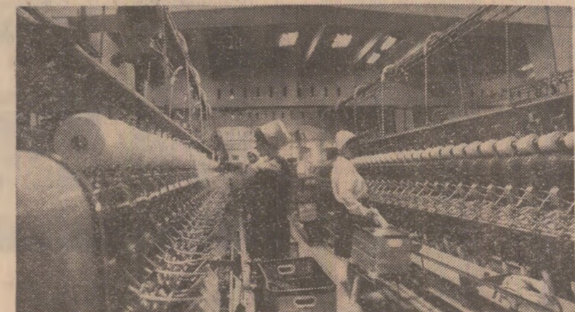
Muncitorele de la Filatura de bumbac întîmplîndu-și ziua de 23 August cu succese deosebite în muncă.