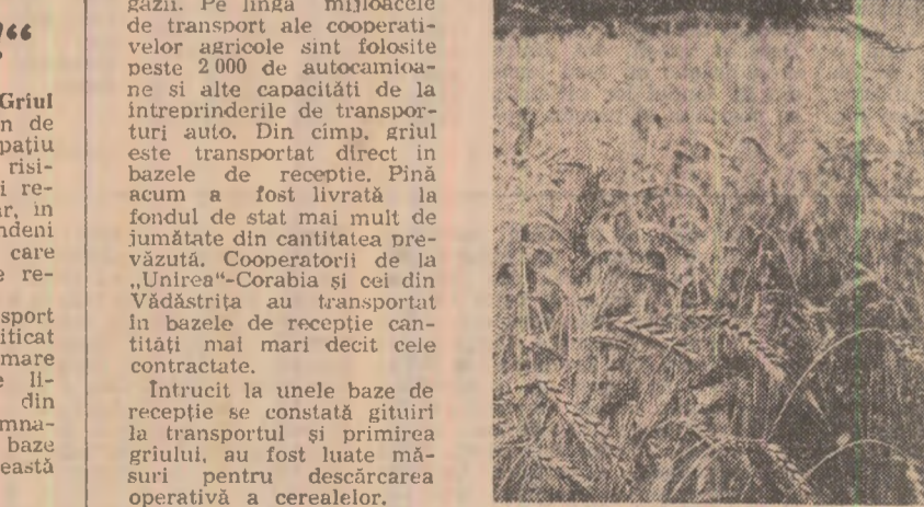
Rod bogat la Vadul Săpat — Prahova

Sub semnul acestei chemări, foaia volantă „Grîul 78” — editată din iniţiativa comitetului judeţean de partid Ilfov — consacră, în ultima sa ediţie, un spaţiu larg grijii pentru fiecare bob de grîu, combatînd risipei şi adăpostirii în cel mai scurt timp a întregii recolte.