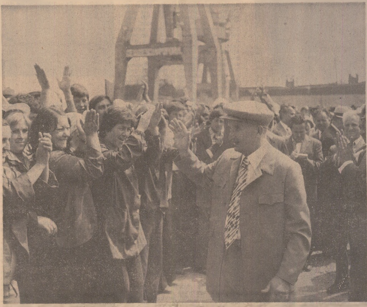
Pretutindeni, primire entuziastă, cu sentimente de profundă stimă