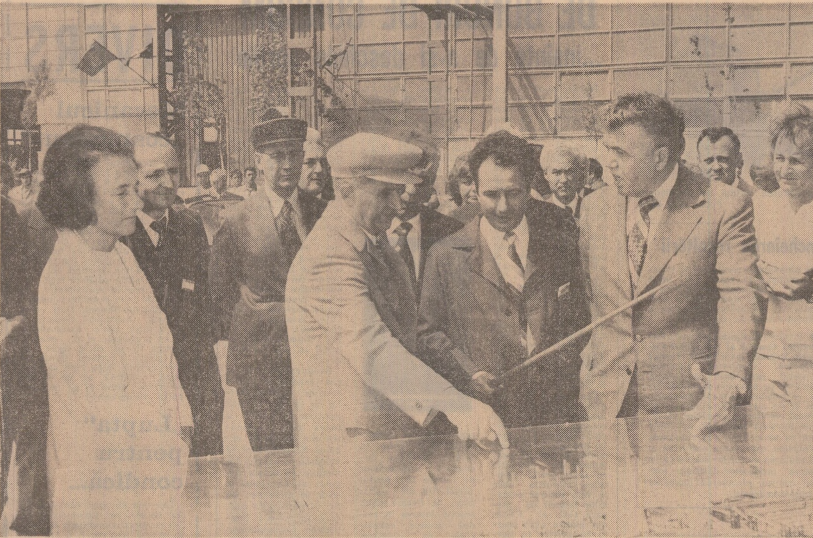
Se examinează viitoarele dezvoltări ale Combinatului metalurgic din Tulcea