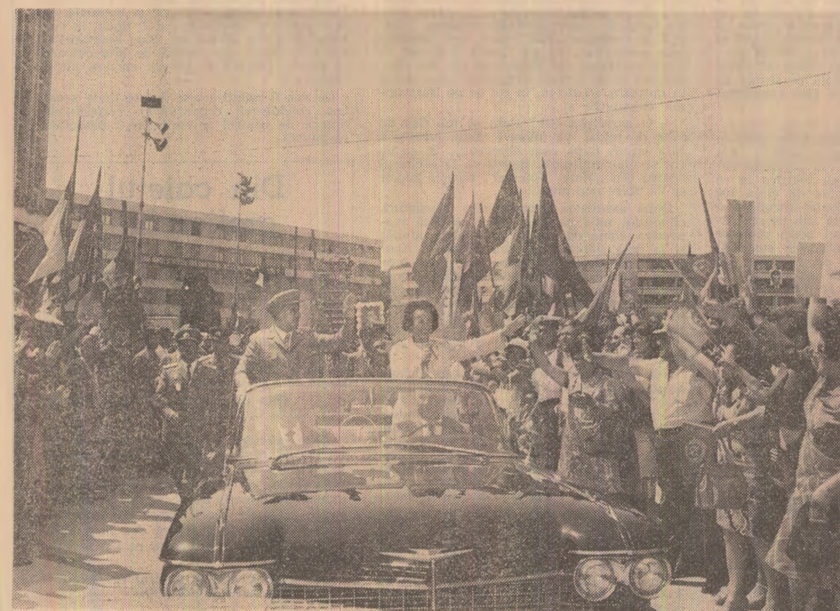
Pe întreg parcursul vizitei, cetățenii au adresat tovarășului Nicolae Ceașescu și tovarășei Elena Ceașescu aplauze și ovații entuziaste

După încheierea dialogului de lucru de la Sulina, tovarășul Nicolae Ceașescu și tovarășa Elena Ceașescu au survolat, la bordul unui elicopter special, zona Deltei cuprîndă între Sulina și Sf. Gheorghe, rezervor natural cu mari resurse economice. Reîntorși la Sulina, tovarășul Nicolae Ceașescu și tovarășa Elena Ceașescu, ceilalți tovarăși din conducerea de partid și de stat ovaționați de localnici, s-au imbarcat pe nava „Mihai Viteazul”, părăsind aceste ospitaliere meleaguri.