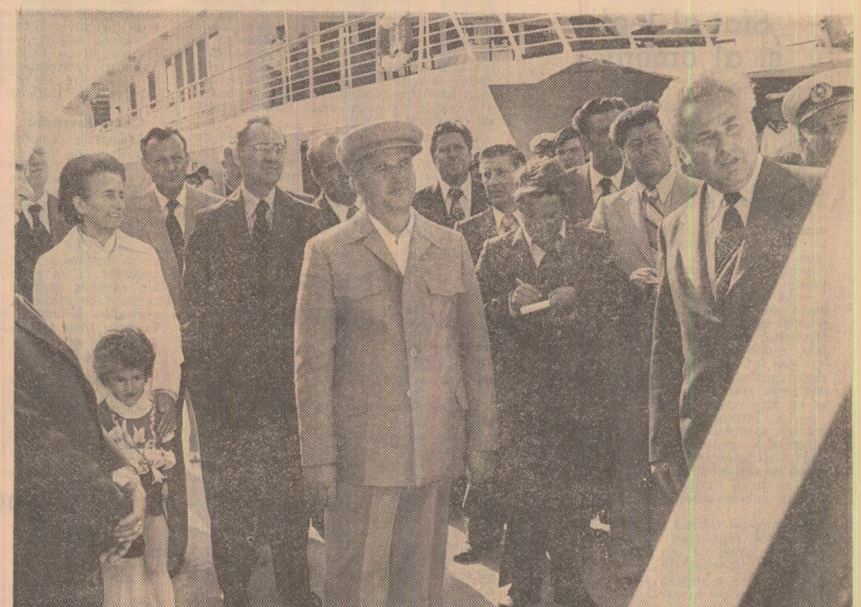
Se analizează probleme ale viitoarei organizării portuare la Sulina