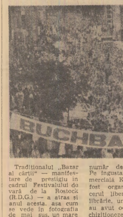
Tradiționalul „Bazarul cărții” — manifestare de prestigiu în cadrul Festivalului de cultură de la Rostock (R.D.G.) — a atras și anul acesta, așa cum se vede în fotografia de mai sus, un mare număr de vizitatori.