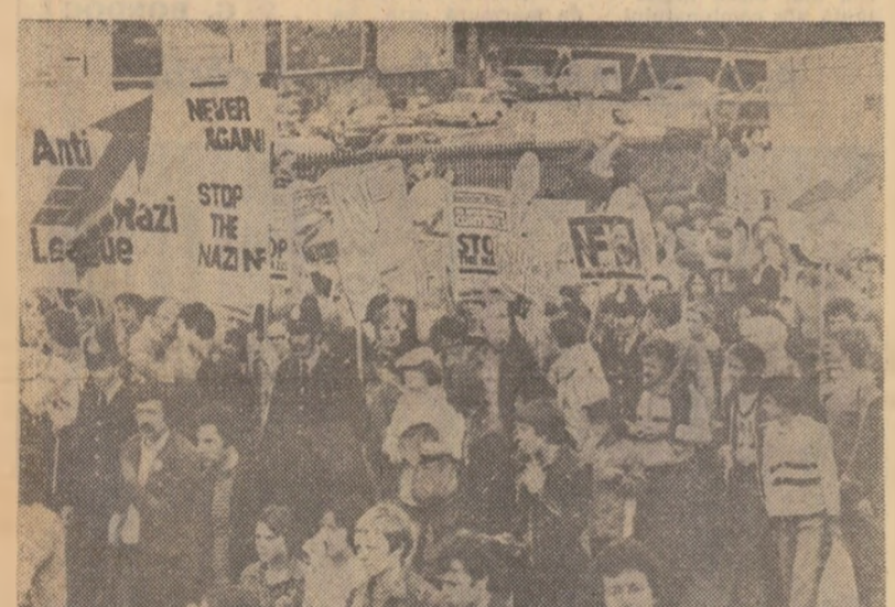
„Stop acțiunilor naziste!” „Nu vom mai permite niciodată repetarea ororilor trecutului!” — scrie pe pancartele purtate de participanții la o mare demonstrație de protest, desfășurată recent la Manchester (Marea Britanie), împotriva recrudescenței activității elementelor neofasciste

dar aceste alegeri nu vor fi organizate pe baza partidelor politice. Noul guvern — a spus el — se va afla la conducerea țării cel puțin patru ani. „La sfârșitul acestei perioade de tranziție, poporul Ghanei va avea prilejul să voteze o nouă constituție și să menționeze șeful statului în alocuțiunea sa. În context, el a arătat că guvernul său a acceptat ca în viitorul guvern național forțele armate și de poliție să nu aibă o reprezentare instituțională.