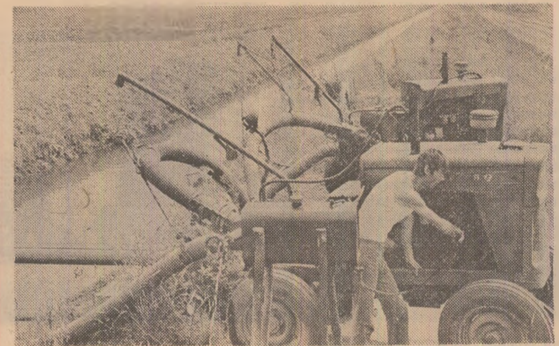
Motopompele funcționează zi și noapte pentru a asigura apa de care au nevoie porumbul și culturile succesive. Aspect de muncă de pe terenurile C.A.P. Curceni, județul Ilfov.