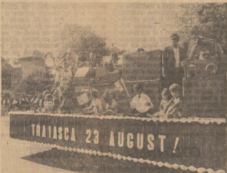
TIRGOVIȘTE. Făuritorii de azi și de mâine ai modernelor mașini și utilaje din noua „cetate de scaun” a metalurgiei și construcțiilor de mașini.