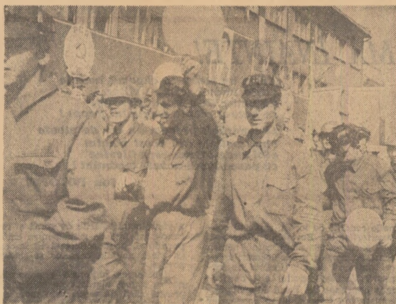
PETROȘANI. În ritm de pas mineresc, voință hotărâtă de a spori necontenit producția de cărbune a țării.