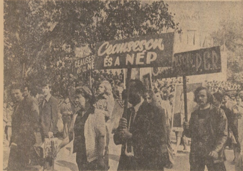
SF. GHEORGHE. Înfrății ca întotdeauna, românii și maghiarii de pe aceste meleaguri au manifestat cu căldură dragostea lor neîmăruntă față de patrie și partid.