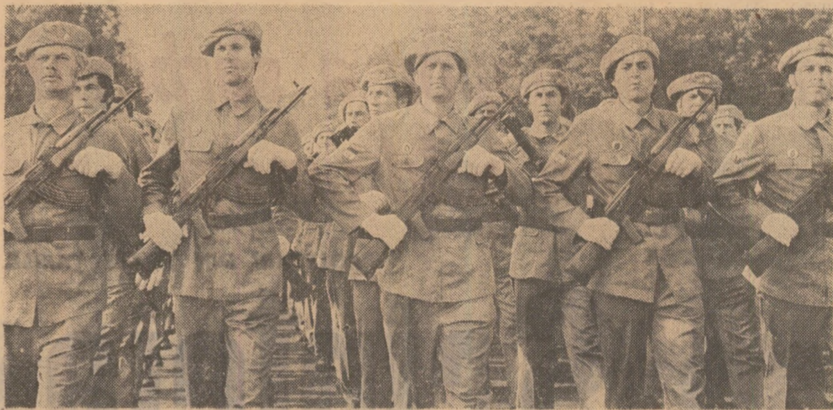
Hotărâre nestrămutată de a apăra, cu viteze brațe muncitorești, cuceririle revoluționare ale poporului

Uriase cârți vii, mișcătoare, se deschid la acest ceas în toate municipiile și ocașele reședințe de județ. Paginile lor sint coloane de oameni, rindurile lor sint rinduri de muncitori, tărani, intelectuali. Literele lor sint brațe voinice și chipuri fericite, grafica lor o formează pancartele și lozincile, steagurile și portretele, multicolorele care alegorice. Cîtim, cit putem cuprinde, cite ceva din multele împliniri împlănite pe fila scrisă de la precedenta aniversare — inoace în letopisețul mereu