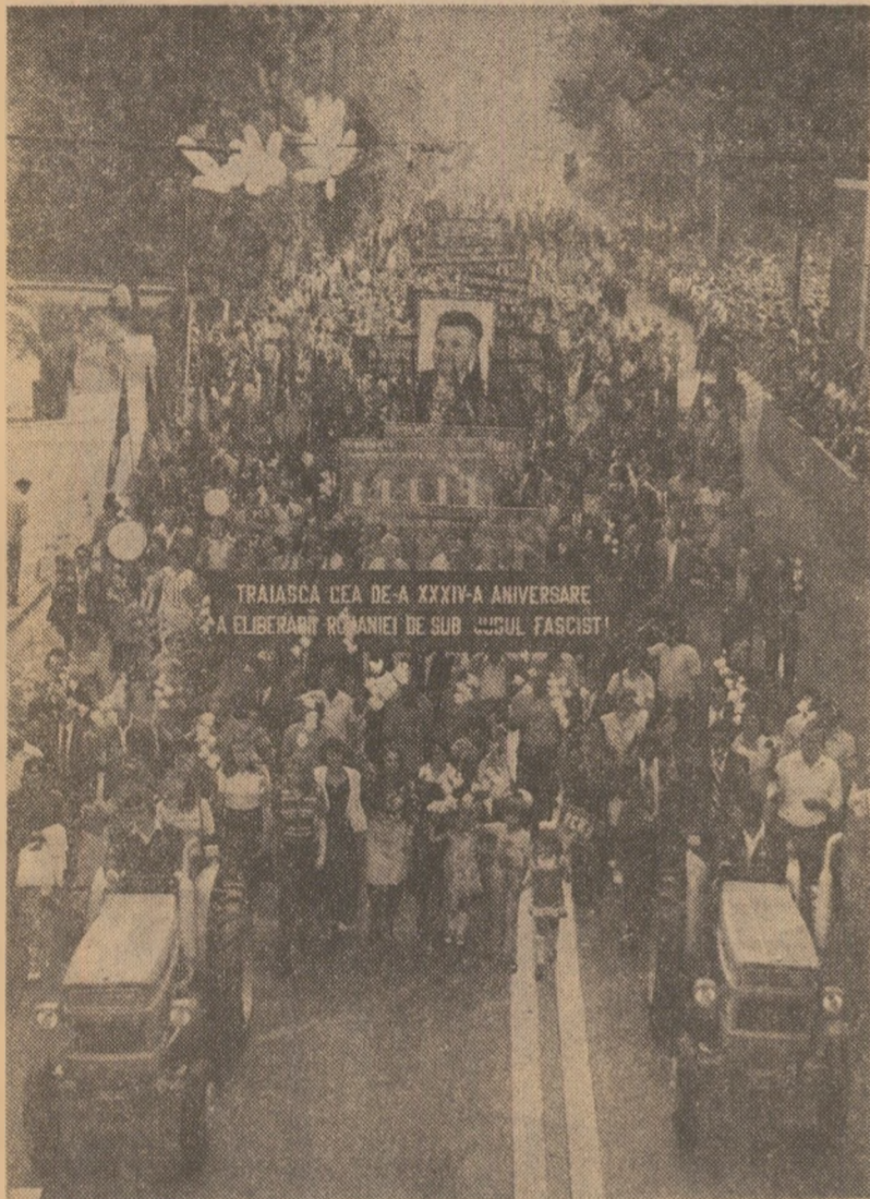
TIMIȘOARA. Elementul inedit al raportului muncitoresc din orașul de pe Bega: noile tractoare realizate de întreprinderea „Tehnometal” din localitate.