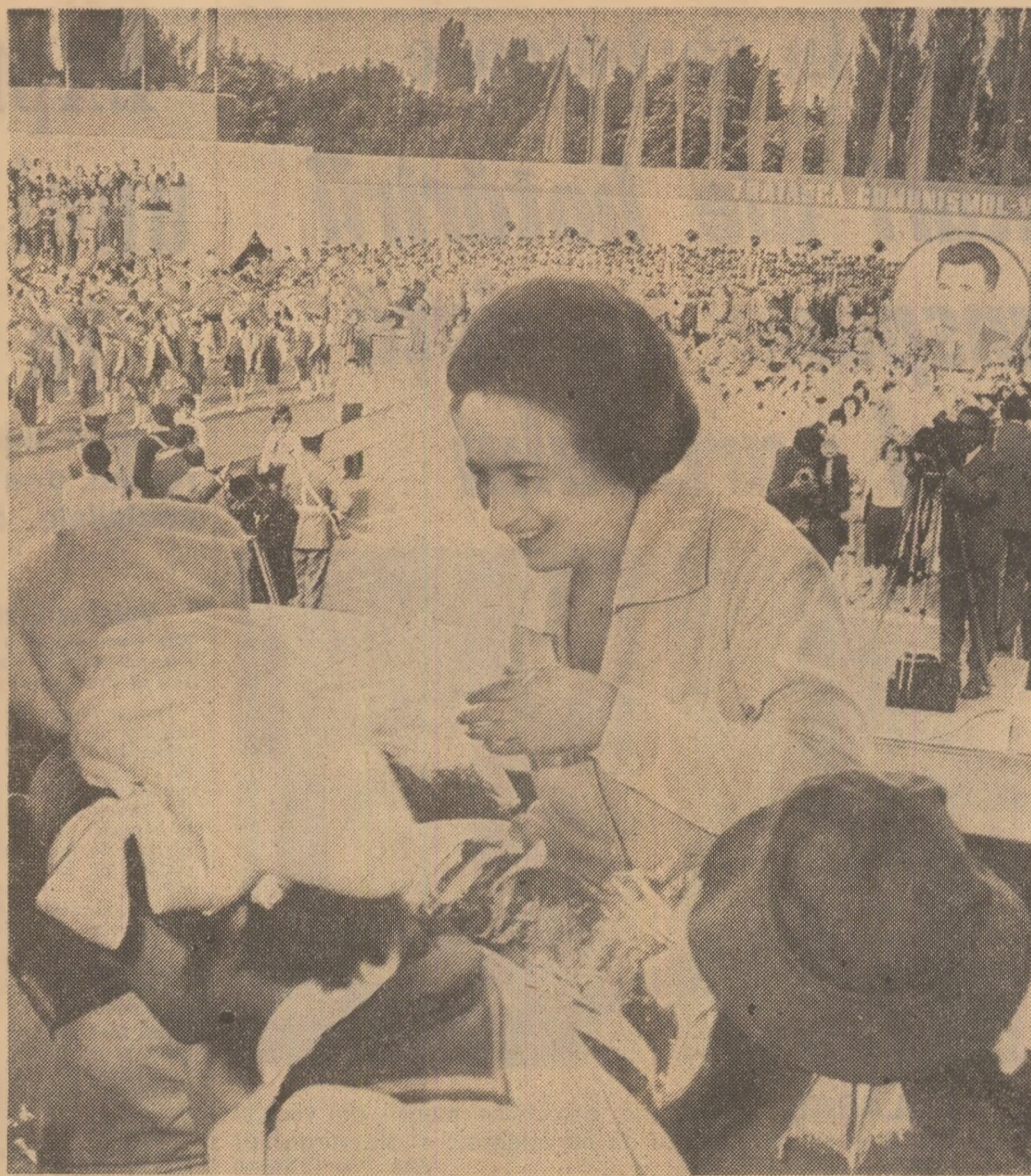
Fiori ale dragostei și recunoștinței