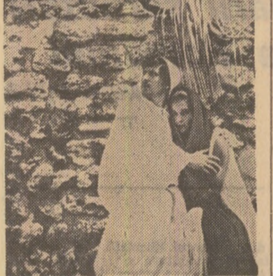
Scenă din spectacolul "Legendele Atrizzilor", prezentat la Cetatea Histria de Teatrul dramatic din Constanța