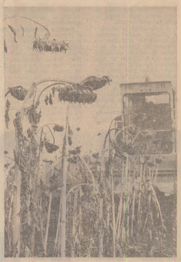
La recoltarea florei-soarelui, în cîmpia Teleormanului