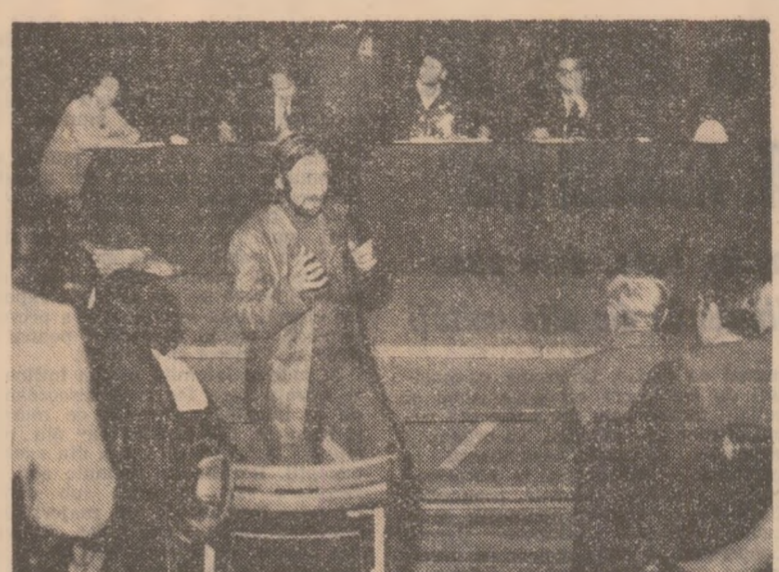
Secvență din spectacol