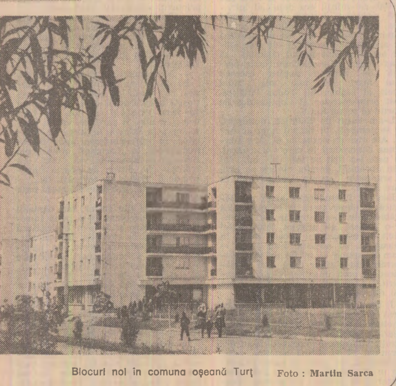
Blocuri noi în comuna oșeană Turț