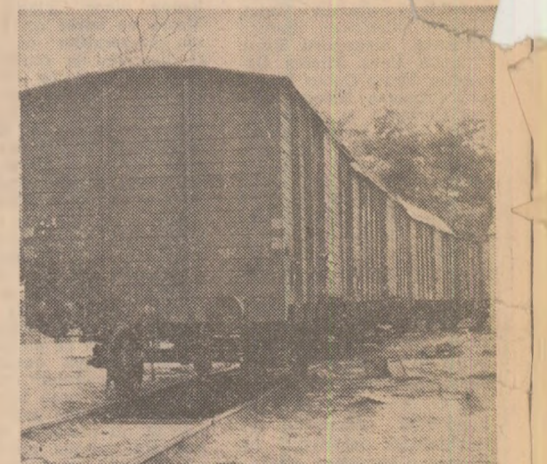
Într-o puține vagoane erau imobilizate cu mîrfuri în stația C.F.R. Cotroceni și în alte stații, în loc să fie folosite la transportul semînțelor