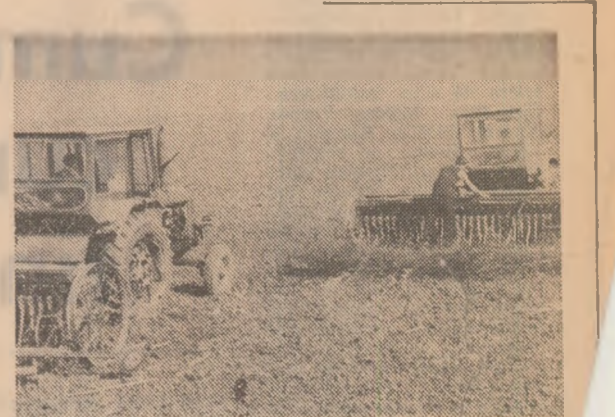
Semănatul păioaselor a început, dar mari cantități de semînțe n-au ajuns încă în unitățile agricole...

Imaginea alăturată este un foarte edificator argument pentru a convinge că semănatul culturilor de toamnă a început. E inutil să mai spunem că prima condiție pentru buna desfășurare a acestor lucrări este ca fiecare unitate agricolă să dispună de cantități suficiente de semînțe. Iar dacă am țînut să facem această precizare este numai și numai pentru că acum, cînd sîmînța de orz și, în unele locuri, chiar și cea de griu, care ar trebui să fie pusă sub brazdă, zace încă prin magazinele unor baze de recepție, aflate la multe sute de kilometri de unitățile agricole respective. Concret, este vorba de cele 20.500 tone de sîmînță de orz și griu produse și condiționate în județele Ilfov, Neamț, Teleorman și Ilmiș, ce trebuiau trimise unităților agricole care nu și-au putut asigura în întregime sîmînța necesară sau au prevăzut să extindă unele soiuri pe care nu le-au cultivat pînă acum. Pentru buna desfășurare a acestor acțiuni conducerea recoltării de valorificare a cerealelor a dispus ca din planul de transport al centralei să se asigure cu prioritate vagoane pentru transportul acestor semînțe. La vremea res-