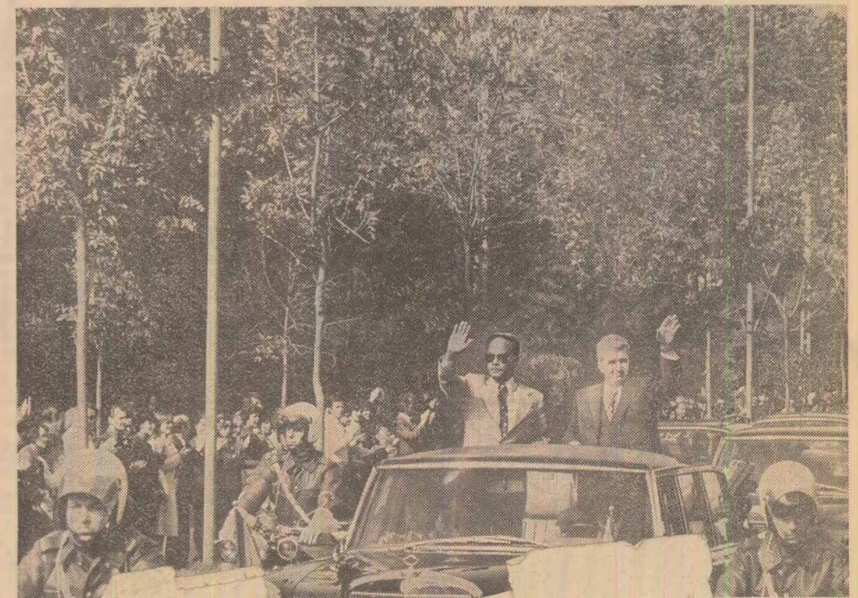
salutați cu multă căldură

Dintr-o mașină deschisă, escortată de motocicliști, președintele Nicolae Ceaușescu și Ziaur Rahman au răspuns cu cordialitate manifestărilor de simpatie ale bucureștenilor veniți în întîmpinare.