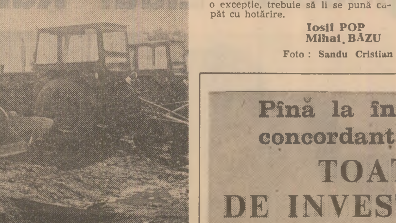
La secția de mecanizare din Gherăseni, 10 tractoare n-au tras în ziua raidului nostru nici o brazdă! Mecanizatorii, vînzînd că nu îl îndrumă și controlează nimeni, au plecat prin sat. Pe post de paznic au lăsat un... cățel care nu lătră, nu mușcă