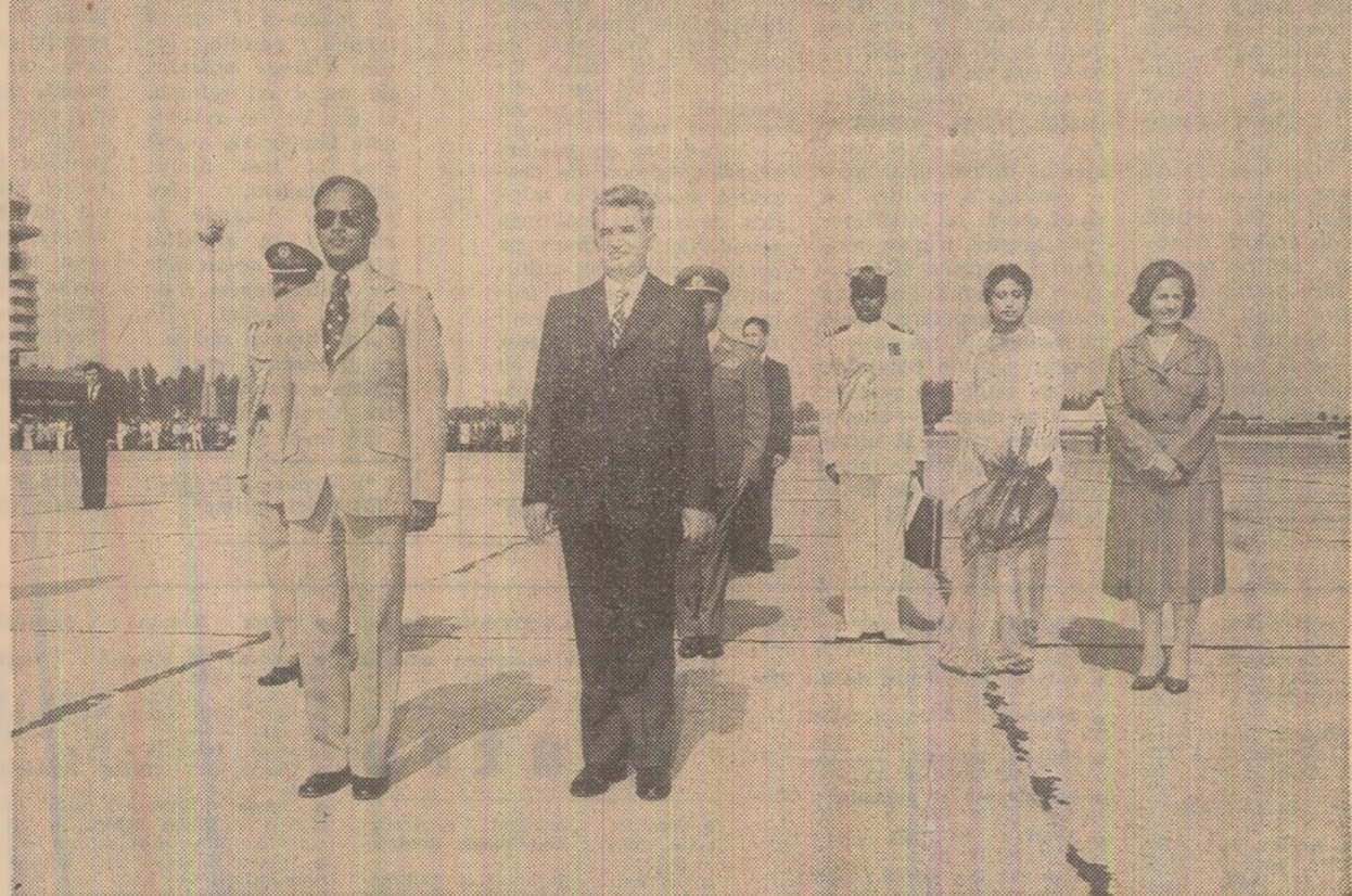
La sosire, pe aeroportul Otopeni

În sănătatea dumneavoastră, a tuturor! (Aplauze).