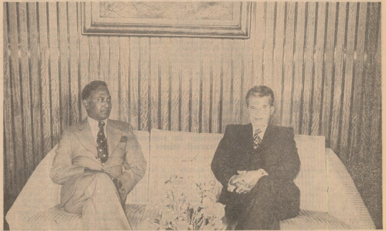
La Palatul Republicii a avut loc, miercuri după-amiază, o întîlnire între președintele Republicii Socialiste România, Nicolae Ceaușescu, și pre-